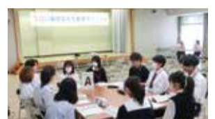
高校生みえ創造サミット

【警察官の働き方改革について】警察官が働きやすい職場環境づくりについて調査します。