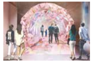
万博の好機を捉えた三重の魅力発信！

【大阪・関西万博に向けた取り組みの推進について】大阪・関西万博開催の好機を捉えた、本県の認知度向上および観光誘客につなげるための取り組みについて調査します。