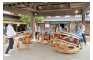
子どもの活動を支援します！

【共生社会の実現について】ひきこもり状態にある方や認知症を抱える方などが安心して暮らせる地域づくりについて調査します。