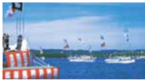
「全国豊かな海づくり大会」開催に向けて

【きれいで豊かな海づくりに向けて】「きれいで豊かな海」の実現に向けた取り組みについて調査します。