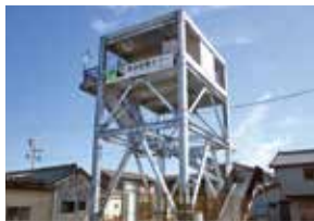
津波避難タワー（志摩市大王町群名）

【水道用水・工業用水の安定的な供給】水道施設および工業用水道施設の耐震化・老朽化対策の推進について調査します。