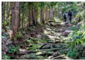
熊野古道の魅力を発信！ 南部地域の振興

【南部地域の振興】地域資源を生かした南部地域の振興に向けた取り組みについて調査します。