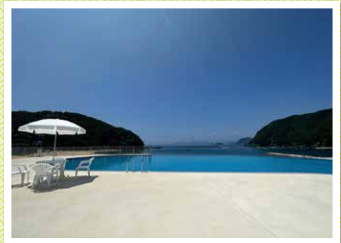
熊野灘臨海公園（城ノ浜地区）のインフィニティプール（紀北町）