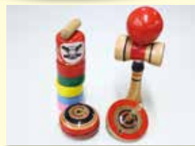
伊勢玩具 サルスベリ・チシャノキ