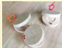
カスタネット クリ