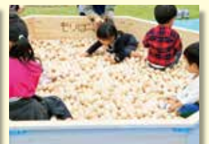
もりぼーる ヒノキ