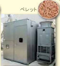
冷暖房用 ペレットボイラー