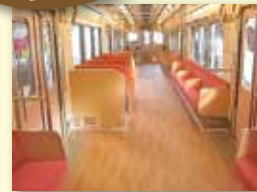
列車 スギ・ヒノキ ナラ・カエデ