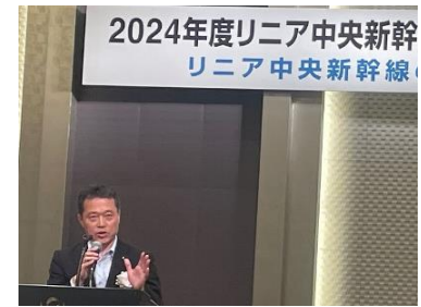
リニア全国同盟会総会(R6.6.7)