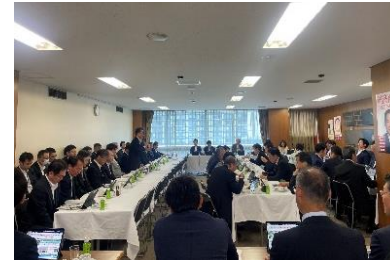
自民党超電導リニア鉄道に関する特別委員会(R6.6.7)