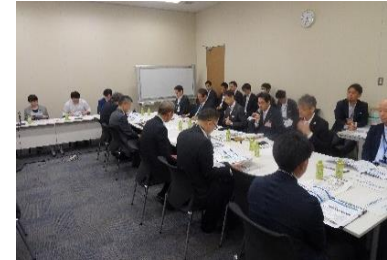
大阪-名古屋-東京間リニア中央新幹線早期実現を目指す議員連盟総会(R6.6.6)