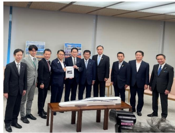
岸田内閣総理大臣への表敬訪問(R6.6.7)