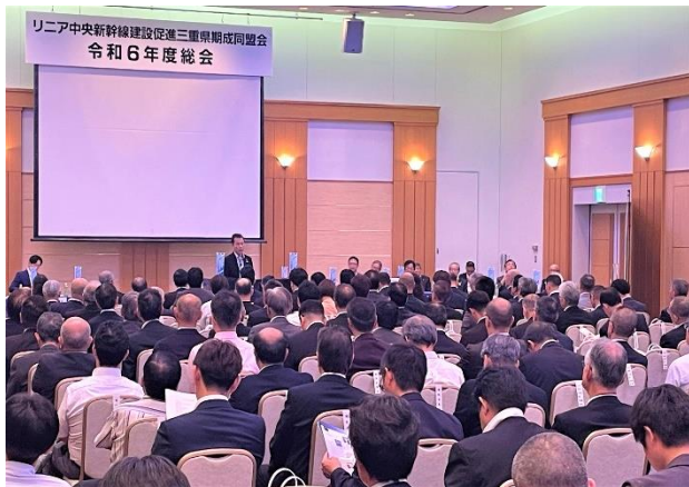
リニア三重県同盟会総会(R6.7.1)