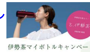
伊勢茶マイボトルキャンペーン