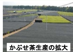
かぶせ茶生産の拡大