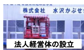
法人経営体の設立