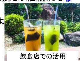
飲食店での活用(伊勢茶ハイ)