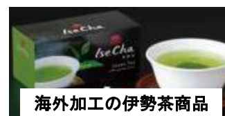
海外加工の伊勢茶商品