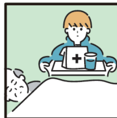
がん・難病・精神疾患など慢性的な病気の家族の看病をしている。