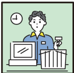
家計を支えるために労働をして、障がいや病気のある家族を助けている。