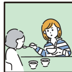
障がいや病気のある家族の身の回りの世話をしている。