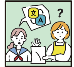
日本語が第一言語でない家族や障がいのある家族のために通訳をしている。