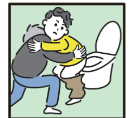
障がいや病気のある家族の入浴やトイレの介助をしている。

ヤングケアラーの支援については 市区町村の「こども家庭センター」 又は児童福祉担当部署までご連絡ください