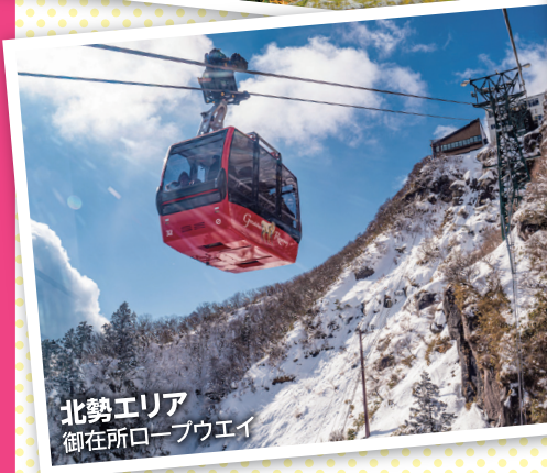
北勢エリア 御在所ロープウェイ