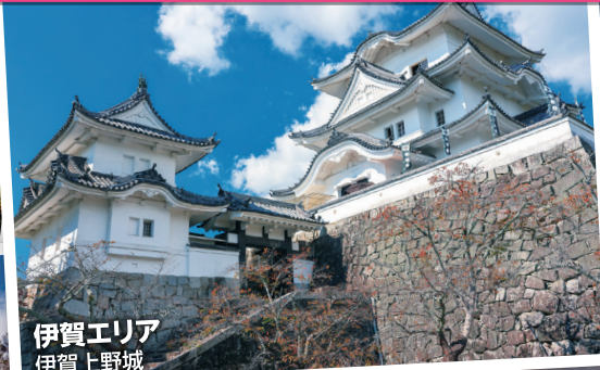
伊賀エリア 伊賀上野城