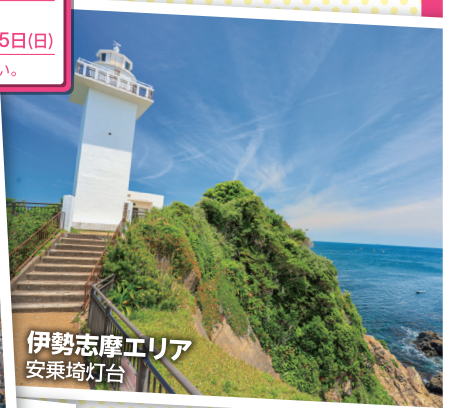
伊勢志摩エリア 安乗埼灯台