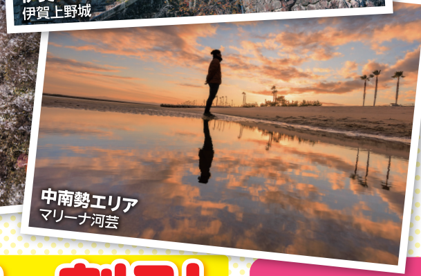
中南勢エリア マリーナ河芸