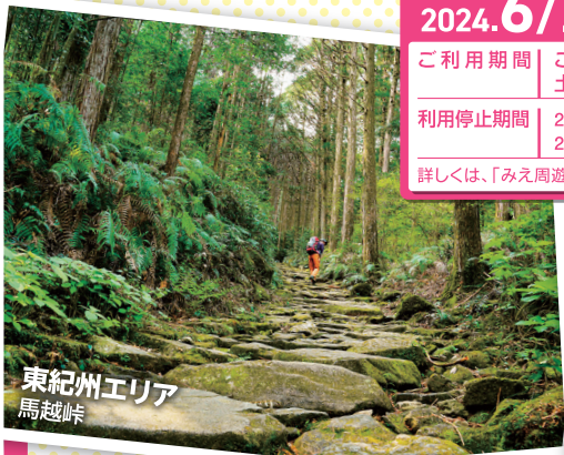
東紀州エリア 馬越峠

実施期間 2024.6/21(金)から2025.2/15(日)まで お買物券は 2/28(金)まで有効 ご利用期間 ご出発日から連続する2日間もしくは3日間以内において、土、日、祝でない平日を1日以上含む場合(平日利用)とします。 利用停止期間 2024年8月9日(金)~8月18日(日) 2024年9月14日(土)~9月16日(祝・月) 2024年9月21日(土)~9月23日(祝・月) 2024年12月26日(木)~2025年1月5日(日) 詳しくは、「みえ周遊ドライブプラン」で検索し、NEXCO中日本「速旅」公式サイトでご確認ください。