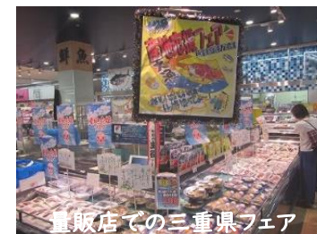
量販店での三重県フェア

サプライチェーンの構築や商品の発掘・開発に強みがあるコンサルタント事業者への委託により、大規模消費地である首都圏や関西圏のこれまで連携がない、水産物の販売に力を入れている量販店等において、県産水産物のフェアを定期的かつ継続的に開催し、販売チャンネルの拡大を図り、恒常的な販路の確保につなげます。