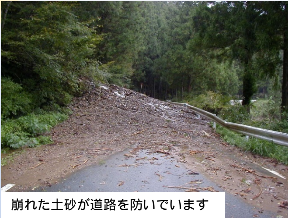
崩れた土砂が道路を防いでいます