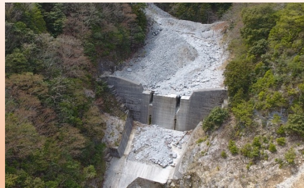
上流から流れてきたたくさんの土砂をとめています