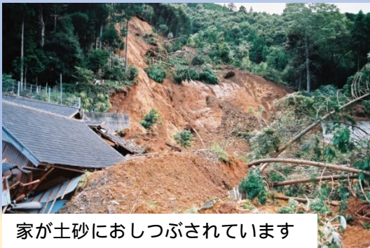
家が土砂におしつぶされています