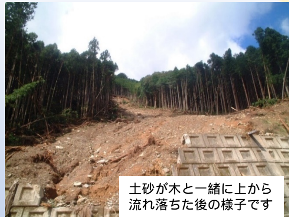
土砂が木と一緒に上から流れ落ちた後の様子です