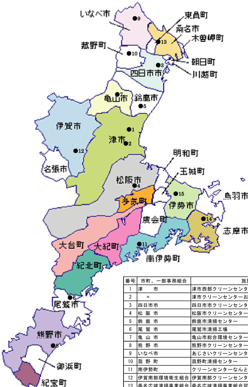
IX (1) 一般廃棄物（可燃ごみ）処理施設の位置図