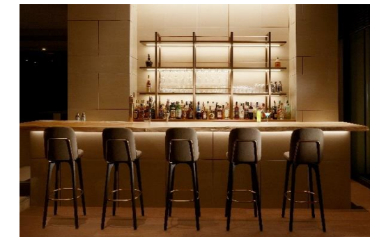
バーカウンターは、トチノキの一枚板