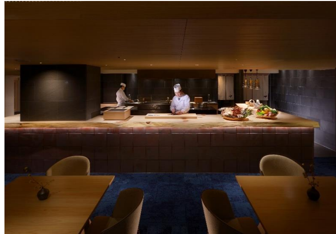
ヒノキのカウンター下は、四日市の万古タイルを使用