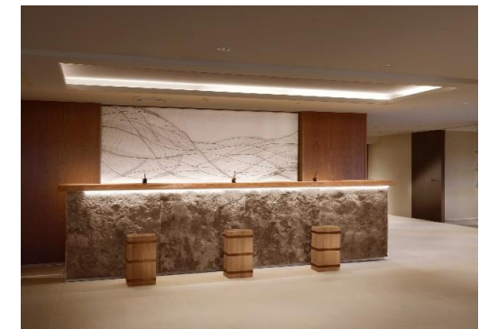
荷物置きはヒノキを束ねたオブジェとして形つくられたもの