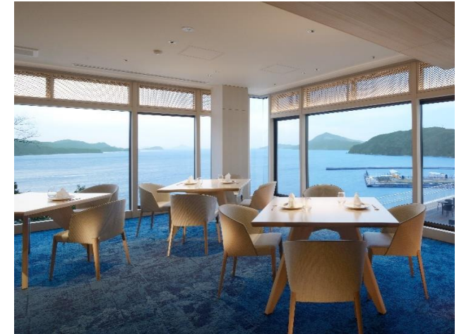
大きな窓から海に浮かぶ鳥羽の島々が一望できる