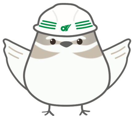
県土整備部 公式マスコット「ちどりん」