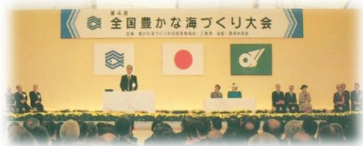
第4回三重県大会(昭和59年)

豊かな海づくり活動功績団体表彰、最優秀作文の発表、漁業者メッセージ、大会決議、大会旗引継などを行います。