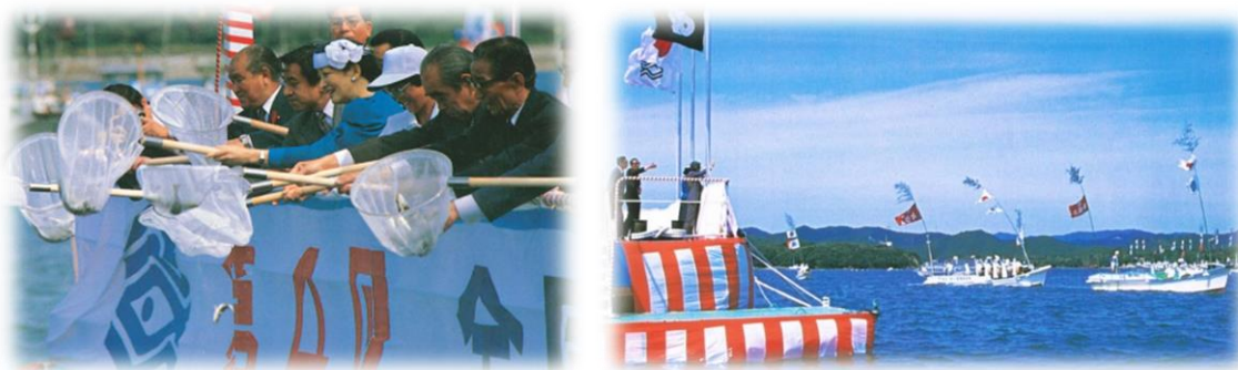
海上歓迎・放流行事 第4回三重県大会(昭和59年)

※演出計画は、先催県の例を参考に記載したものであり、関係機関等と協議の上、調整・決定します。