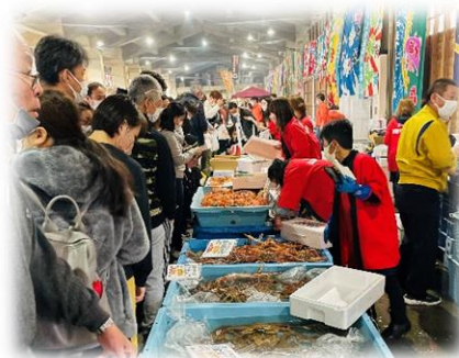
過去大会の関連行事の実施状況