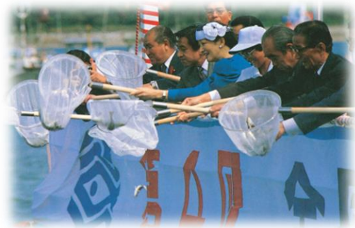
海上歓迎・放流行事