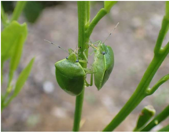
図3 カンキツの新梢への加害