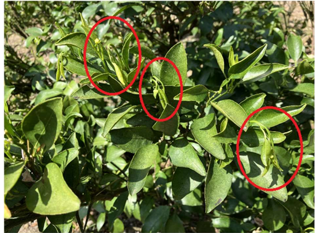
図4 加害を受けてしおれた新梢