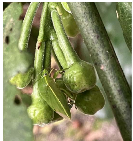
図2 カンキツの花蕾への加害