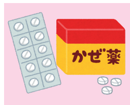
市販薬の過量服薬