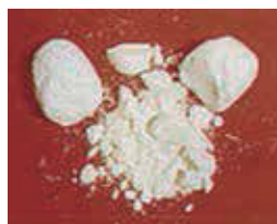
あへん系麻薬 (ヘロインなど)