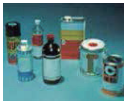
有機溶剤 (シンナー)