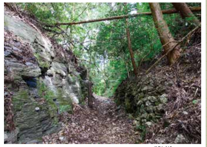
熊野古道伊勢路 女鬼峠(多気町)