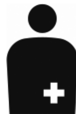
【オストメイト用設備/オストメイト】 所管：公益財団法人交通エコロジー・モビリティ財団