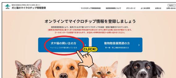
犬と猫のマイクロチップ情報登録サイト トップページ