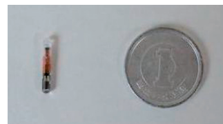
直径1.2mm、長さ8mm程度の円筒形の電子標識器具です。

この個体識別番号をあらかじめ「犬と猫のマイクロチップ情報登録」サイトに登録しておくことで、迷子になって保護されたときなどに、飼い主に連絡することができます。