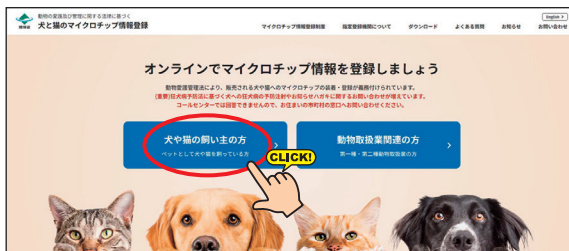
犬と猫のマイクロチップ情報登録サイト トップページ