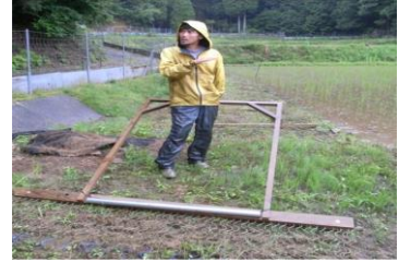
有機栽培の水田(左)と野菜(中)の現地巡回。生産者考案の水田除草機(右)