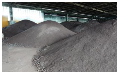
香川県東かがわ市の廃菌床を用いた堆肥センター