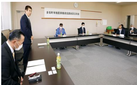
多気町有機農業推進協議会への参加