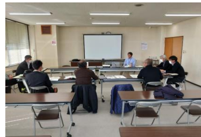
有機米の栽培推進と学校給食への供給を進める千葉県いすみ市への視察