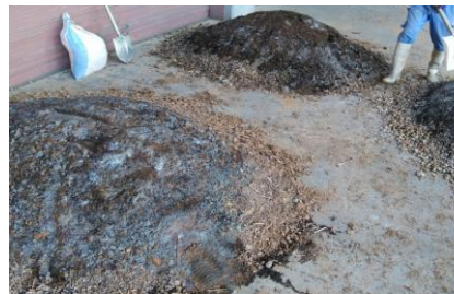
関係機関と協働で実施した廃菌床の堆肥試作