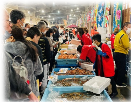
過去大会の関連行事の実施状況