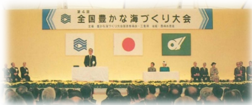
第4回三重県大会(昭和59年)

豊かな海づくり活動功績団体表彰、最優秀作文の発表、漁業者メッセージ、大会決議、大会旗引継などを行います。