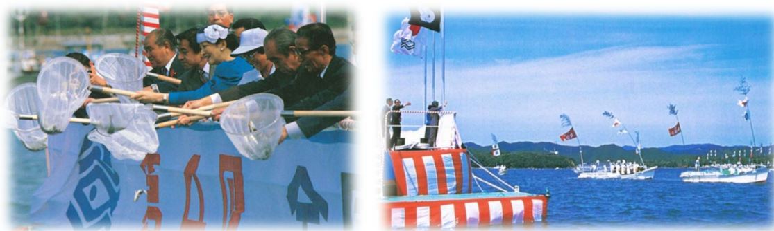
海上歓迎・放流行事 第4回三重県大会(昭和59年)

※演出計画は、先催県の例を参考に記載したものであり、関係機関等と協議の上、調整・決定します。