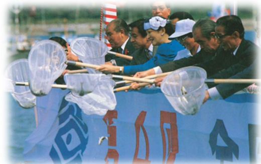
海上歓迎・放流行事