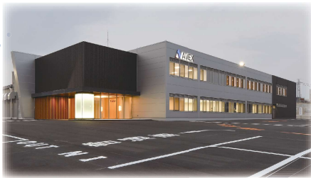
エイベックス株式会社