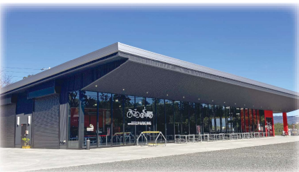
株式会社フジ技研