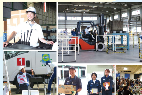
従業員を大切にする取組

また、運転技能大会への出場を支援するなど、従業員の育成に注力。全国トラックドライバーコンテストや全国フォークリフト運転競技大会では女性ドライバーの入賞実績もあり、従業員が挑戦できる環境を整備している。