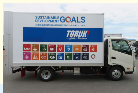
環境に優しいCNGトラック

使用済み天ぷら油を再利用したバイオディーゼル燃料を利用しているほか、CNG(圧縮天然ガス)トラックや電気トラックの導入を推進。また、ハイブリッドトラックも積極的に導入しており、環境に優しいトラックの利用によって、エコ&クリーンな事業を推進している。