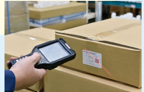
在庫管理に二次元コードを導入

同社では情報のデータベース化を積極的に推進。電子情報として「保存」・関係者間で「共有」・有効的に「活用」という3段階で、生産効率の上昇につなげている。在庫管理に二次元コードを導入したことで、4人で4時間かかった作業が1人で2時間でできるようになったという例もあり、働き方改革に大きく寄与。そのことがペーパーレスの推進や、工場の整頓にもつながり、効率的な作業が可能な環境が実現している。