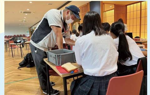
工場での地域の子もたちとの交流

地元からの積極的な雇用や、高等教育機関での講義の実施、若手起業家の育成支援など、地域に根差した活動を積極的に推進。地域と産業の関係の重要性を若い世代や次世代の子どもたちに発信し、人材確保につなげている。徹底的に地元こだわった「地域循環型経営」を進めることで、地域に雇用の場を提供し、地域に必要とされ続ける企業づくりに努める。