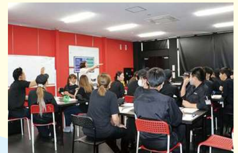
社内でのセミナーの様子