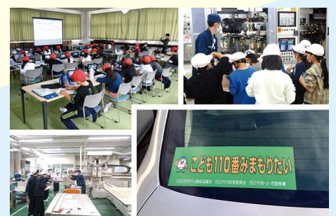
地域の子どもたちを支える取組

地元四日市市の「こども110番みまもりたい」への参加など、地域の子どもたちを守る取組に積極的に協力。また、会社見学やインターンシップ、「小学生のためのお仕事ノート」への協賛も行っている。さらに2017年に三重県の中小企業として初めて「プラチナくるみん」を取得しており、従業員の子育て支援制度も充実。地域の子どもたちの育成を支援する取組に努めることで子どもたちに同社を身近に感じてもらうとともに、社内制度を充実させることで人材確保につなげている。