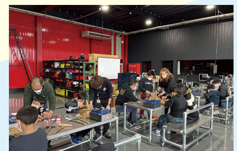
FUJIHUBで開催されているものづくり体験教室

さらにFUJIHUB内のカフェでは、同社が事業承継した養鶏場で採れた「いっちゃんたまご」などの地元産食材を活用した料理やスイーツが楽しめる。企業と地域、人と人をつなげる事業を展開するFUJIHUBは、地元の方々が集まる地域の交流の場となっている。