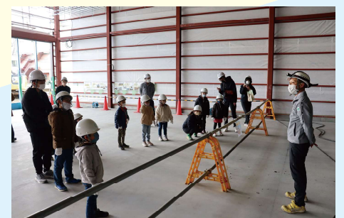
子どもたちを対象にした工事現場見学会

また、先述のSDGs委員会の提案により、従業員の家族を会社見学に招待したり、地域の障がい者就労支援施設が作るお菓子の訪問販売を行ったりといった取組も実施。地域貢献を行いつつ、地域に会社の応援団を増やすこともめざしている。