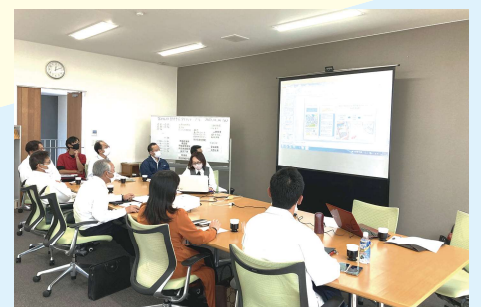
月に一度各部門の長が集まる「部門会」

「サステナブル=生存戦略」と考え、2021年に専門部署「ESG」を設置。同社のESGは「環境・社会・ガバナンス」に加え「教育(Education)・持続性(Sustainable)・成長(Growth)」も意味する。ESG内には脱炭素推進室、働き方改革推進室、リスクリング推進室、CSR推進室等が属し、事業や社会貢献をESGの視点から確認することで、ガバナンスの強化につなげている。また、月に一度各部門の長が集まり「部門会」を実施。従業員の声を経営に反映したり、コンプライアンス意識を共有したりする場となっている。