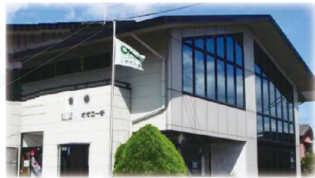
株式会社オオコーチ