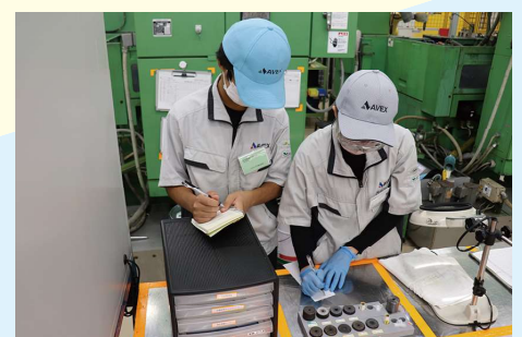
工場内で従業員が着用する帽子を色分け

また、外部との連携によって商品開発の機会を多く確保するなど、従業員に新たな成長機会を積極的に提供し、意欲の向上に努めている。