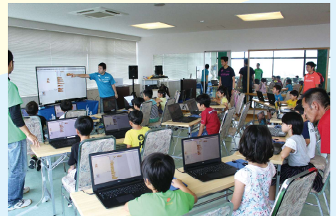
プログラミング教室の様子

サッカー、ドッジボール、運動能力の向上を目的とする「忍者ナイン」など、豊富なメニューのスポーツ教室を地域で気軽に受けられる点が特長。また、小学校でプログラミングが必修化されたことに合わせ、2017年からはプログラミング教室も新たに手掛ける。スポーツやプログラミングを通じた、子どもの成長を応援する取組で、地域社会に貢献している。