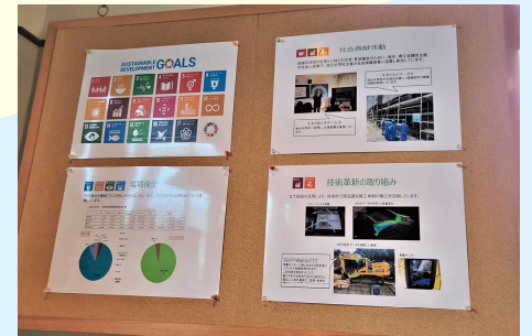
社内ではSDGsに対応した環境保全等の取組について掲示

カーボンニュートラルに向けた取組として、建設現場においてどれだけのCO 2 を排出しているのかの算出を行っている。土木・建築の現場でのCO 2 排出量を細かいところまで把握することで、CO 2 排出の主要因を分析し、よりCO 2 削減効果の高い施工計画の作成につなげることがねらい。自社内部における排出量だけでなく、自社の活動に関連する他社の排出量(Scope3)まで把握を行い、高い環境意識を持った経営に取り組んでいる。