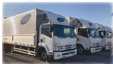
三重執鬼株式会社