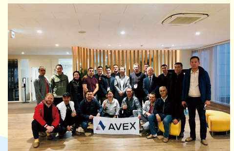
産業観光に訪れた外国人観光客

本業の自動車用精密研削加工部品の製造に加え、地元桑名市と連携して産業観光にも注力していることが大きな特長。国内外の観光客を積極的に受け入れ、地域活性化につなげたことで、2017年には「産業観光まちづくり大賞」の金賞を受賞した。産業観光によって自分の仕事をお客様に見ていただく機会を多く確保することは、従業員の技術力や愛社精神の向上につながり、人材育成の役割も果たしている。