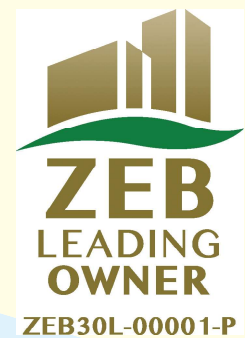
2019年にZEBリーディングオーナーに登録

また、不動産賃貸部門では、建物で消費する年間の一次エネルギーの収支をゼロにすることをめざした建物「ZEB(ゼロ・エネルギー・ビル)」を保有。ZEBである津営業所では、常に省エネの見える化が行われている。また、県内で初のZEBリーディングオーナーとして、ZEBの周知活動にも力を入れている。