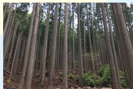
オオコーチ社有林

自社のCO 2 排出量の算定を行い、自社の二酸化炭素排出量の見える化を実施。また2023年2月現在の社有林は市内を中心に約34.6ha(東京ドーム約7.4個分)あり、CO 2 の吸収量は年間506.1トンに及ぶ。森林の機能が十分に発揮されるために、植える、育てる、伐る、使う…という森林の循環を促すよう森を適正に管理し、森林機能の維持と、製材、建築の推進に取り組む。