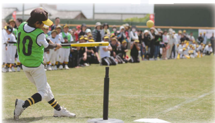
特定非営利活動法人 三重県生涯スポーツ協会