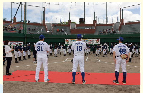
プロのスポーツ選手を招いたイベント

プロのスポーツ選手を招いたスポーツイベントの開催や、公共スポーツ施設の指定管理事業など、スポーツを通じた地域活性化を推進。また、大学での「スポーツツーリズム」の講義の実施や、企業や団体を訪問しての「健康経営」のコンサルティング、子どもの生活習慣調査の実施と自治体へのフィードバックなど、企業や自治体と連携しながら、NPOとしての強みを活かして幅広く地域密着の取組を行っている。