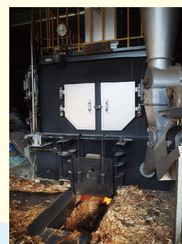
木質バイオマスボイラー

木材の乾燥には木質バイオマスボイラーを利用。重油を極力使用せず、製材で出るおが粉や端材を燃料として活用することで、廃棄物がほとんど出ない体制を実現し、木材を最大限に活用した運用が行われている。さらに、太陽光発電も活用してボイラーのエネルギー削減にも努めるなど、環境に配慮した取組に注力している。