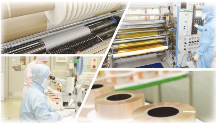
河村産業株式会社