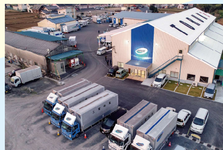
本社と所有トラック

地域から必要とされ、愛される会社になることが、従業員の誇りや幸せにもつながっている。