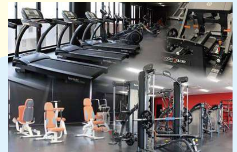
福利厚生棟のスポーツジム

また、女性従業員の希望から、子連れ出勤も可能に。保育専門スタッフによる預かりが利用でき、安心して仕事に取り組める。さらに、キッチンスペースやシャワールーム、仮眠室も完備されており、従業員は寝泊まりも可能。このような充実した福利厚生で、従業員満足度は高い。