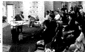
三重テラスでの就職イベント

若者の県内就労やU・Iターンを促進するため、ニーズに沿った就労支援や情報提供を行うとともに、転職潜在層への効果的な情報発信等を行います。