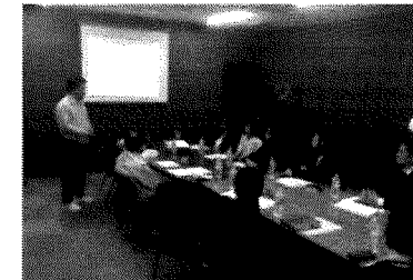
企業へのアドバイザー派遣