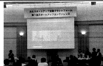
みえスタートアップ支援プラットフォーム 第1回カンファレンス

県外から移住し、デジタル技術を活用した地域課題の解決を目的とする起業等を行おうとする者に必要な経費の一部を補助するとともに、経営面等に係る伴走支援を行います。