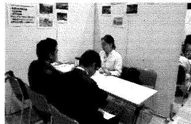
海外での合同面接会 (イメージ)

障がい者雇用・就労促進課 ⑨、⑩、⑪ 224-2461 中小企業・サービス産業振興課 ⑫、⑬、⑮ 224-2534 産業イノベーション推進課 ⑭ 224-2227