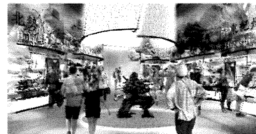
大阪・関西万博 三重県ブース（イメージ）

2025年大阪・関西万博に向けて、展示製作・工事、運営準備のほか、万博会場内における催事の検討等に取り組むとともに、子どもたちが万博会場でSDGsや世界の文化などについて学ぶ校外学習等に対して支援します。