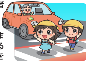
横断歩道は歩行者優先

横断歩道は歩行者優先です。運転者には横断歩道手前での減速義務や停止義務があります。歩行者の横断を妨げないようにしましょう。歩行者や他の車両に対する「思いやり・ゆずり合い」の気持ちを持って運転しましょう。