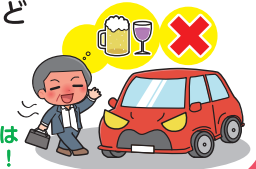
飲酒運転は絶対ダメ！

飲酒運転やあおり運転（妨害運転）は極めて悪質で危険な犯罪です。アルコールは少量の摂取でも安全運転に必要な情報処理能力、注意力、判断力などを低下させ、交通事故の危険を高めます。お酒を飲んだら絶対に車を運転してはいけません。あおり運転もやめましょう。