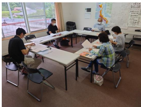
「避難行動要支援者名簿」の精査