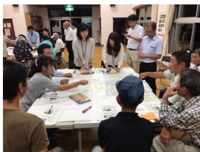
避難所運営マニュアルの作成