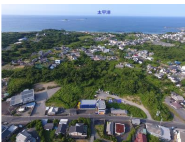
(株) 山下組 社屋 (遠景)

こうした同社の取組は、地域と企業が連携して防災・減災対策を進めるにあたっての先進的なモデルとなるものです。