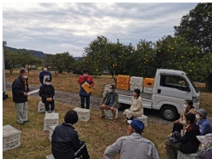
地区の避難訓練実施時に家具固定の重要性を説明

また、「家具固定の推進」においては、地区独自の補助制度を創設し、役員が実際に住宅を訪問して希望の聞き取りや家具固定器具の設置を行い、地域の家具固定を推進しています。これらの取組は、他地域でも参考になるものであり、今後の活動の発展に期待ができるものです。