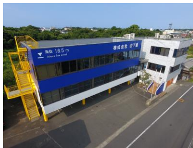
(株) 山下組 社屋 (近景)