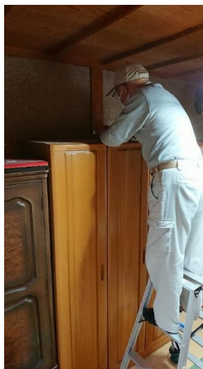
家具固定器具の取付