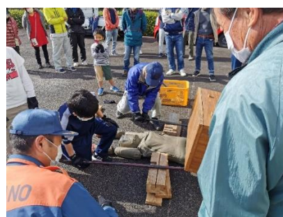
総合防災訓練での住民レスキュー訓練