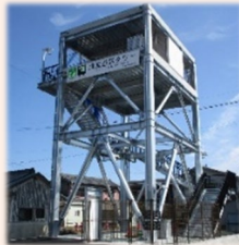
津波避難タワー（志摩市）