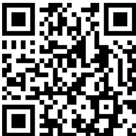
会場参加用二次元コード