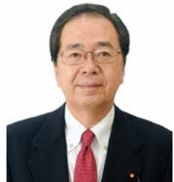
国土交通大臣 齊藤 鉄夫

2023（令和5）年6月16日から18日に開催した「G7三重・伊勢志摩交通大臣会合」は、成功裏に幕を降ろすことができました。これも、開催地となりました三重県及び志摩市、また、周辺の伊勢市、鳥羽市及び南伊勢町を始めとした多くの関係者の皆様の多大なる御支援と御協力のお陰です。ここに深謝の意を表します。