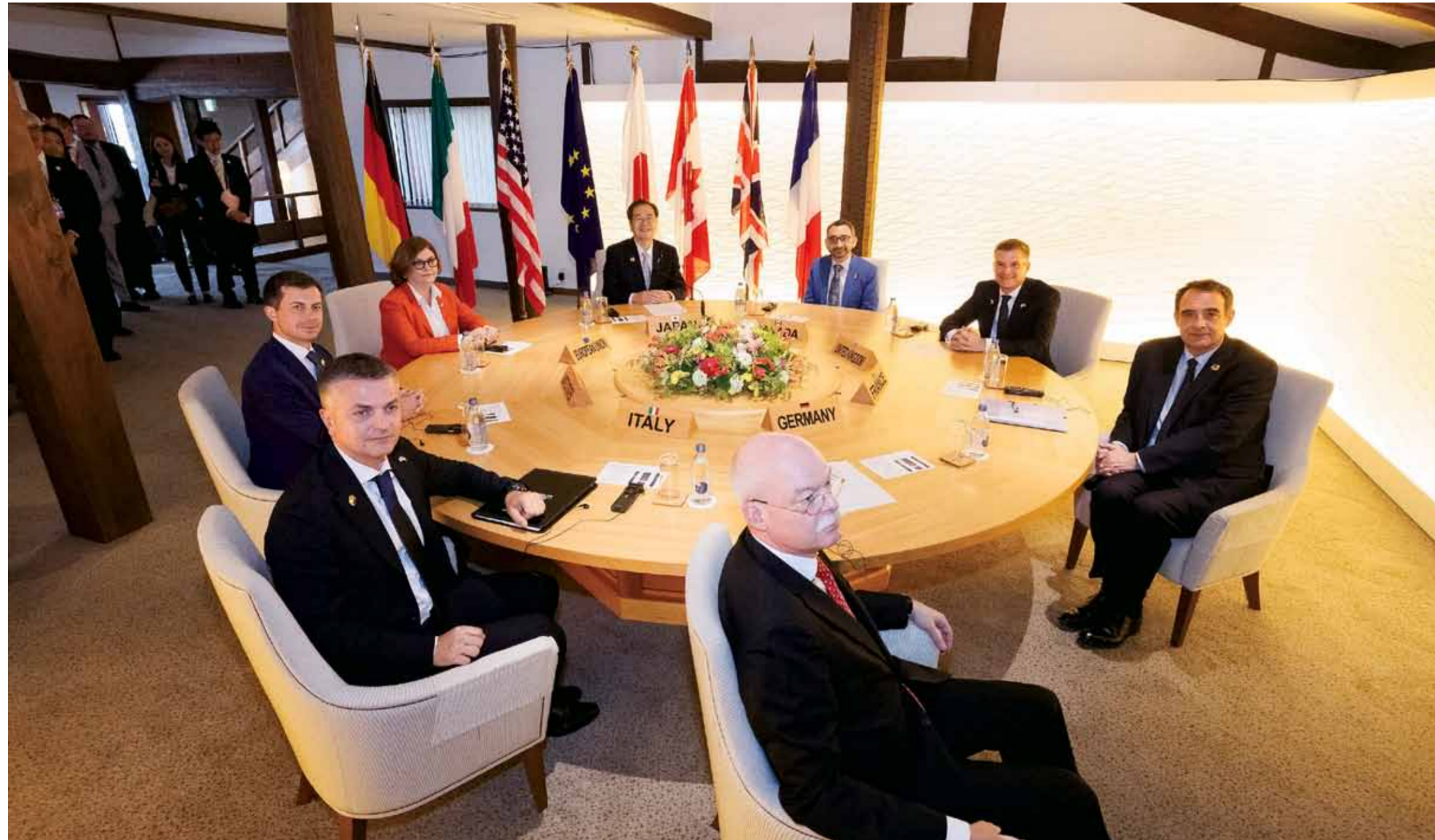
志摩観光ホテル ザ クラブ 「光壁」