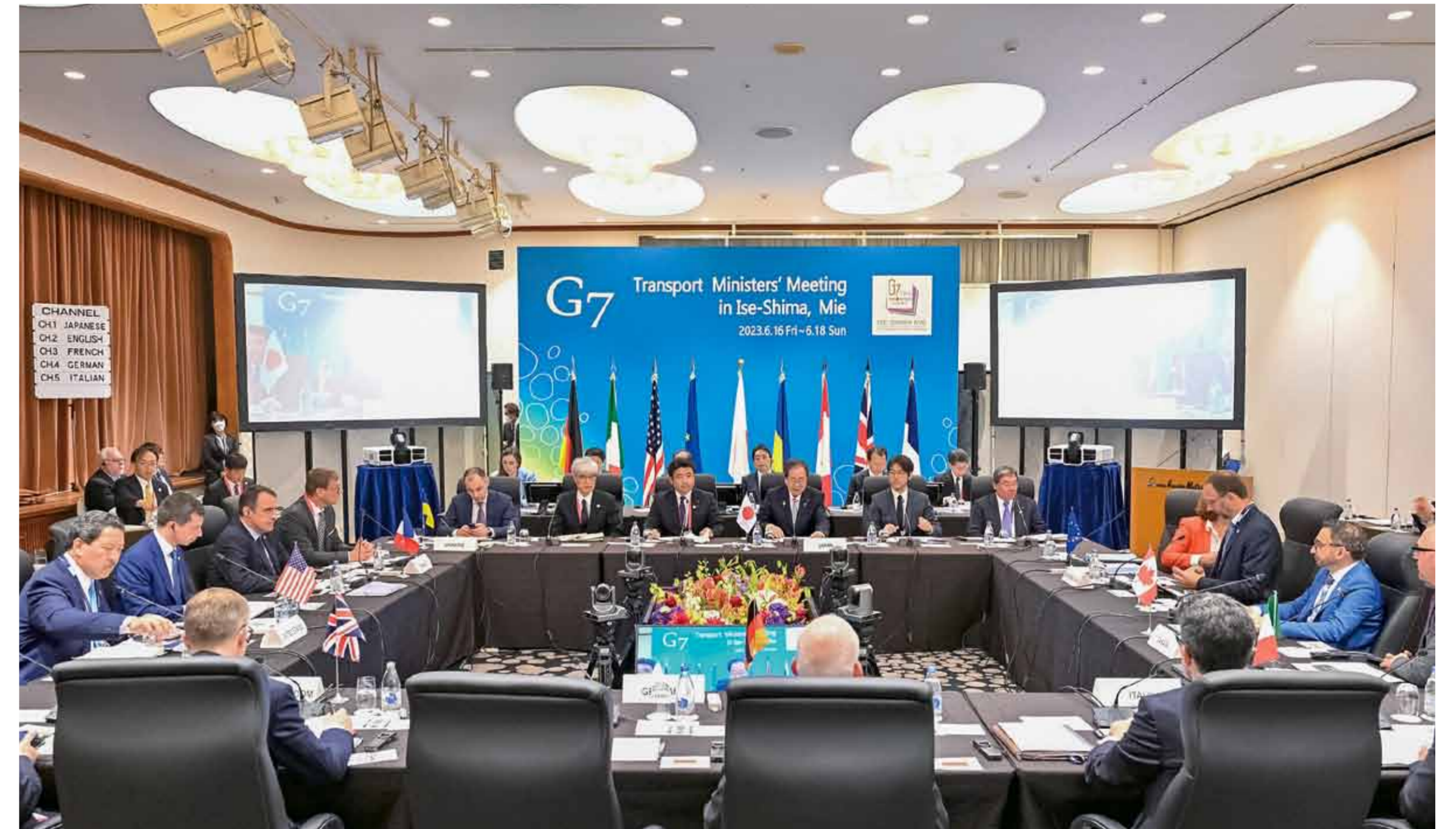
志摩観光ホテル ザ クラシック 真珠の間