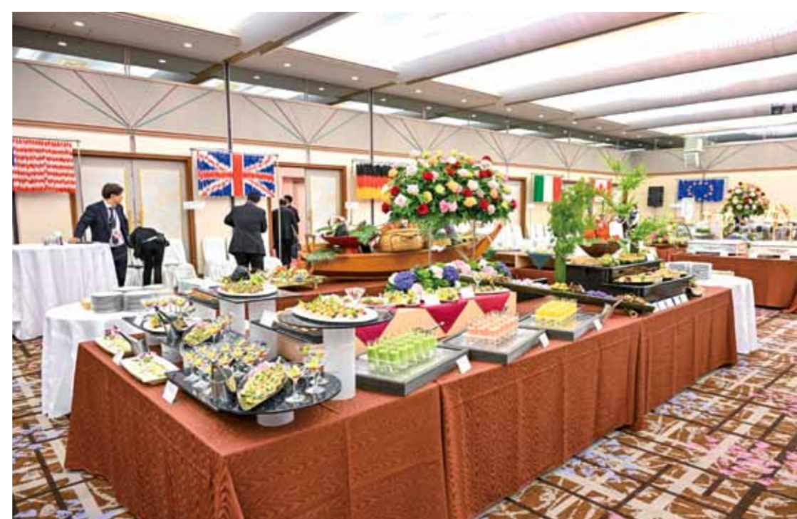
賢島宝生苑 「華陽の間」