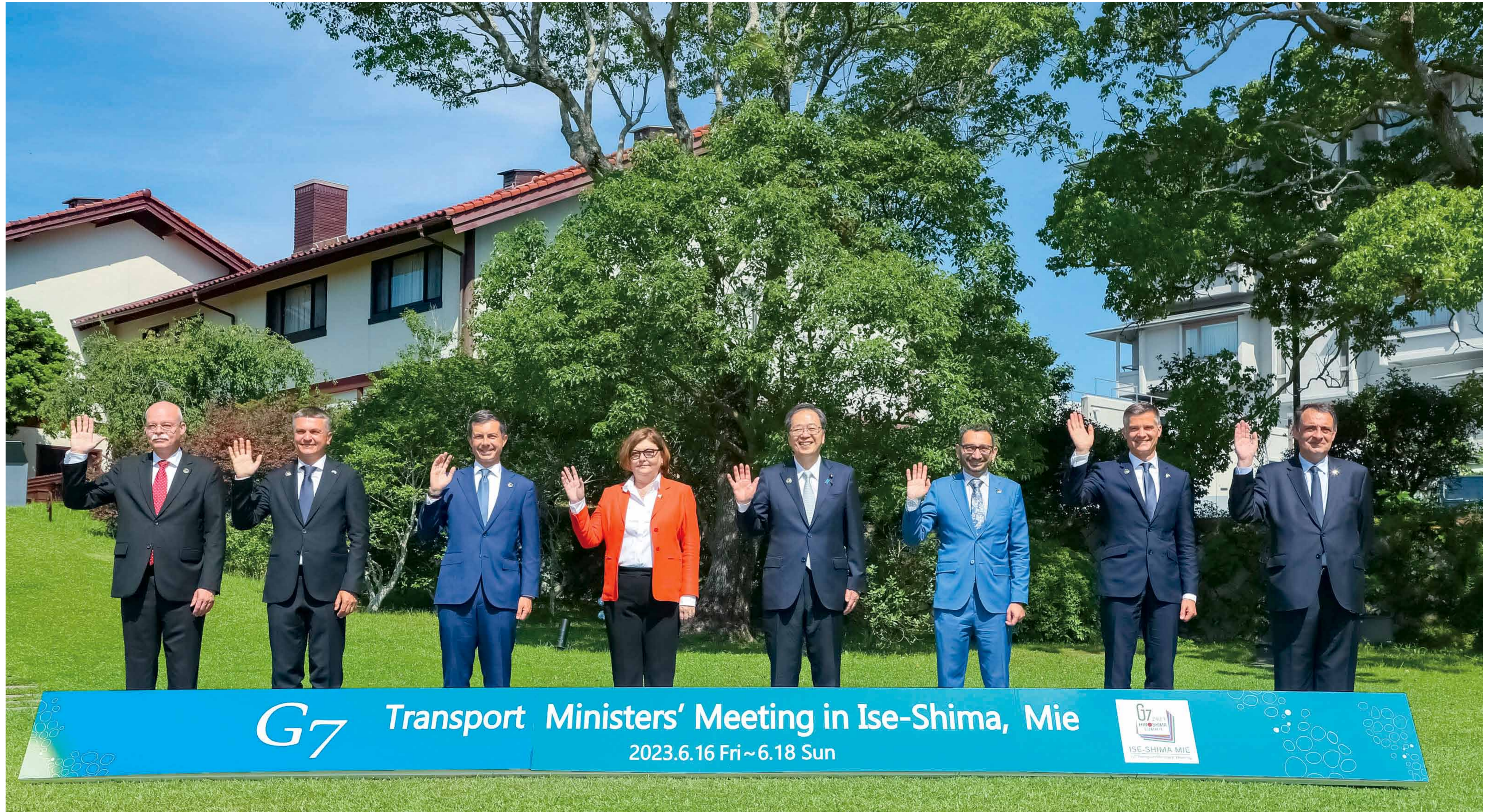
左から、[ドイツ] クレーメンス・ゲツェ駐日独大使、[イタリア] エドアルド・リクシインフラ・交通副大臣、[アメリカ] ピート・ブティージェッジ運輸長官、[EU] アディーナ・ヴァレアン欧州委員会運輸担当委員、[日本] 齊藤鉄夫国土交通大臣、[カナダ] オマール・アルガブラ運輸大臣、[イギリス] マーク・ハーパー運輸大臣、[フランス] フィリップ・セトン駐日仏大使