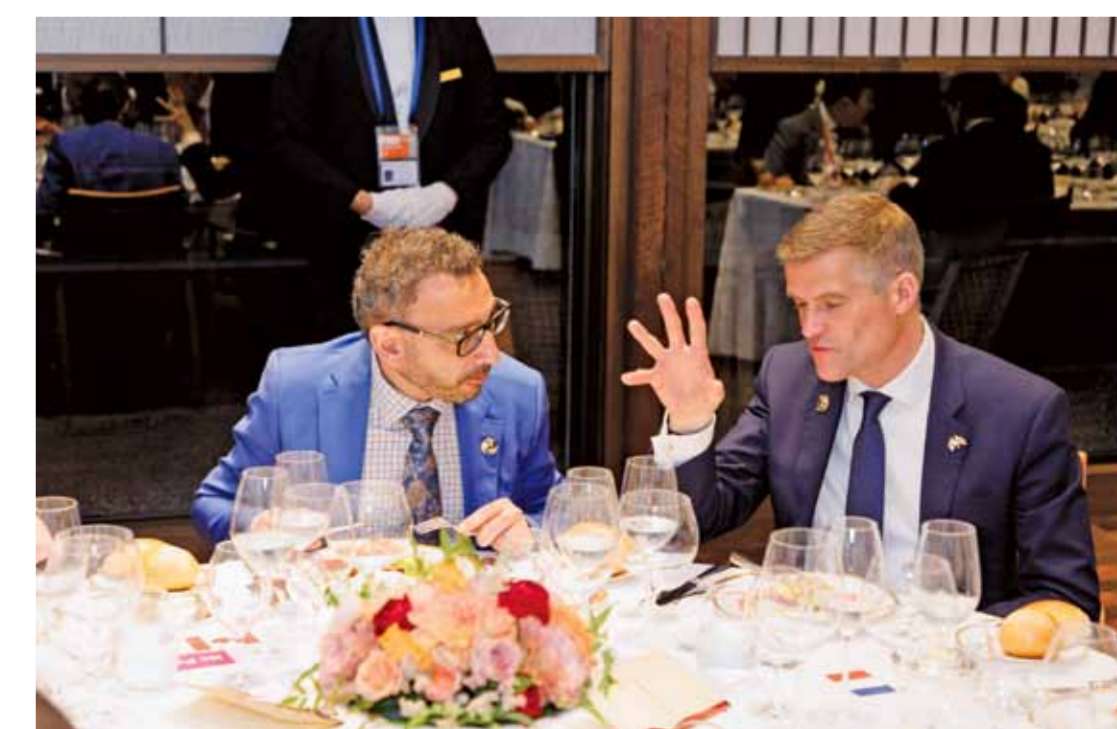
志摩観光ホテル ザクラブ 「リアン」