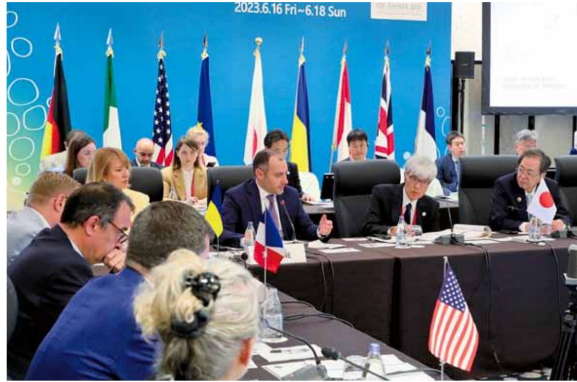
[ウクライナ] オレクサンドル・クブラコフ 復興担当副首相兼地方自治体・ 国土・インフラ発展相