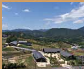
里創人 熊野倶楽部