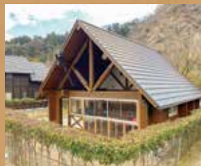
青川峡キャンプパーク