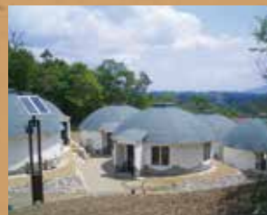
伊賀の里モクモク手づくりファーム