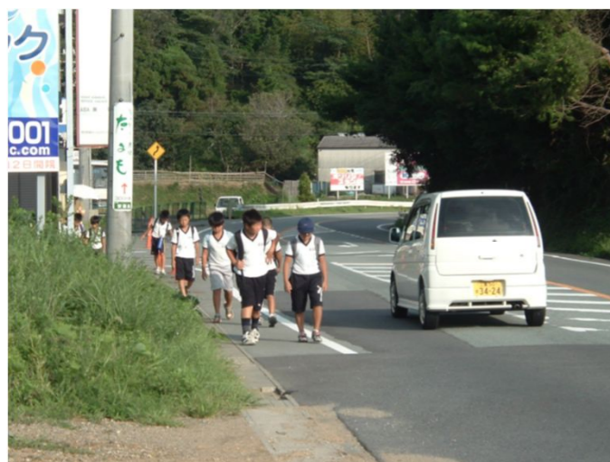
安乗港線(志摩市阿児町国府～鵜方)