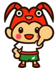
みえスポーツ応援マスコット「とこまる」

伊勢えびをモチーフにし、現在も「みえスポーツ応援マスコット」であり県のマスコットとして定着している「とこまる」を題材として、海づくり大会にちなんだコスチュームデザインを全国から募集し、大会広報に活用します。