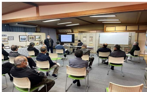
毎年数回実施している 獣害対策研修会