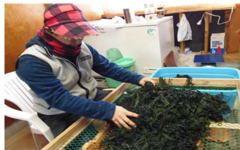
「山と海との交流」 「ひじき」の加工の様子