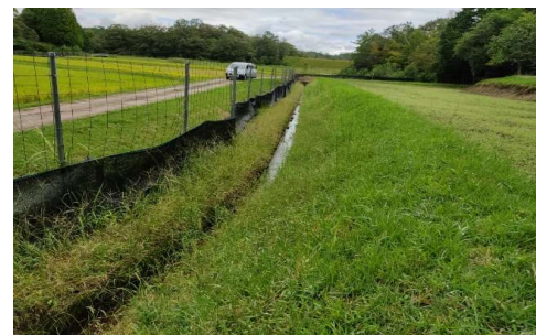
一帯を目隠しすることで イノシシによる柵破壊を防いだ