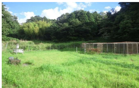
ICTを活用した大型捕獲檻設置 農業研究 所と取り組み、サルの群れ管理に使用