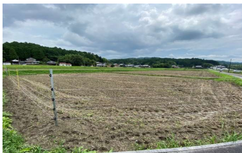
低コスト電気柵設置 (大豆圃場)