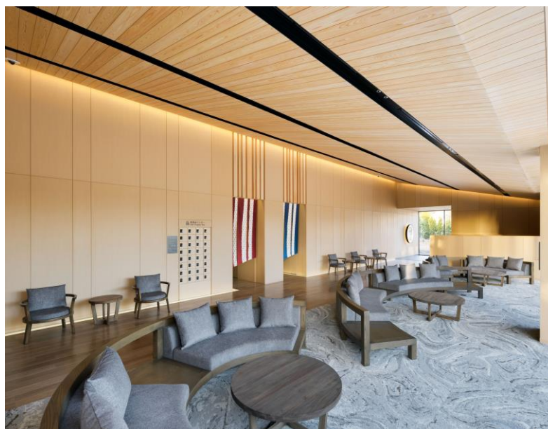
インテリア:壁や天井に木質系材料を用い、安らぎのある空間づくりをしている