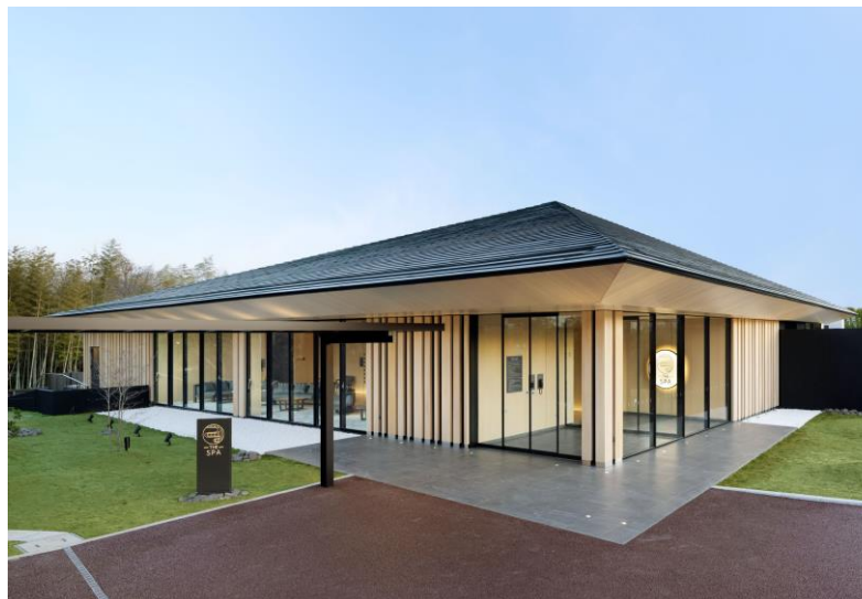
全景:外壁や軒に三重県産材のスギとヒノキを使用

今後も全国から訪れるお客様へ地元三重県産材の魅力を発信していきたいと考えています。