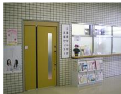
がん相談支援センター

また、本県では、病院外における相談窓口として「三重県がん相談支援センター」を設置しており、地域のがん患者や一般県民等からの相談に応じています。「三重県がん相談支援センター」では、相談対応の他、県内各地域におけるがんサロンの開催や、サポーター養成研修の実施、三重県で過ごすがん患者に必要な情報を取りまとめた冊子である「三重県の療養情報」の作成など、がん患者への支援のための様々な取組を行っています。