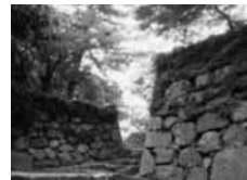
松坂城跡 (国指定史跡)

松坂城は戦国武将・蒲生氏郷によって1588(天正16)年に築かれた平山城。本丸と二ノ丸に石垣を築き、かつては3層の天守に敵見、金の間、月見などの櫓が配された堅城だった。現在は、そびえ立つ石垣を残し公園として整備され、桜や藤、イチヨウの名所として広く市民に親しまれている。