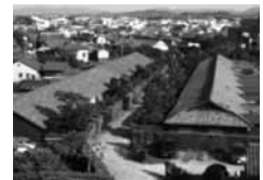
御城番屋敷 (国指定重要文化財)

松坂城は戦国武将・蒲生氏郷によって1588(天正16)年に築かれた平山城。本丸と二ノ丸に石垣を築き、かつては3層の天守に敵見、金の間、月見などの櫓が配された堅城だった。現在は、そびえ立つ石垣を残し公園として整備され、桜や藤、イチヨウの名所として広く市民に親しまれている。