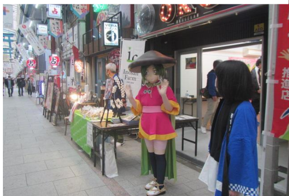
津フェスタ in 天神橋筋商店街3丁目