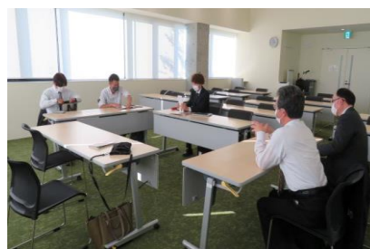
第2回検討会議、いなべ市「にぎわいの森」見学、意見交換