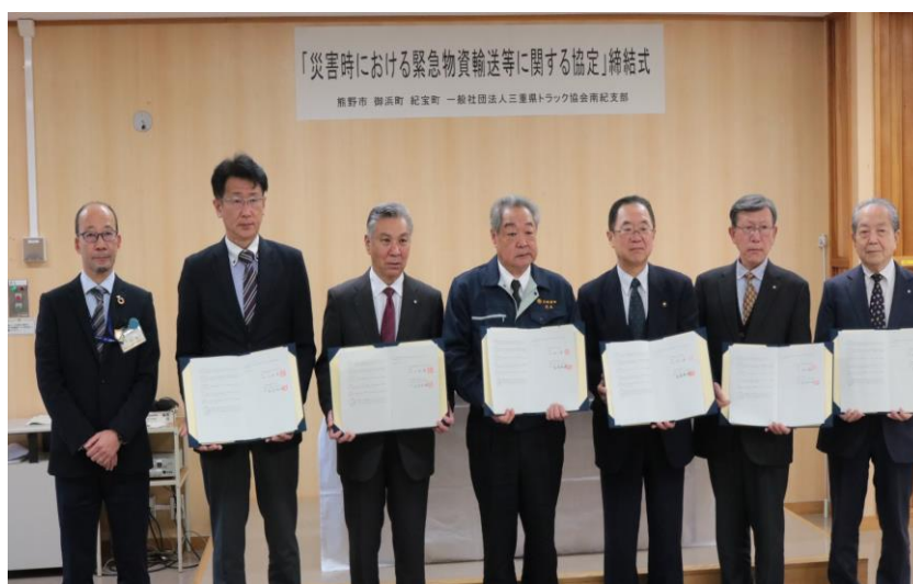
協定締結式 令和5（2023）年2月22日