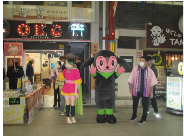
見つけた三重 in 天神橋筋商店街