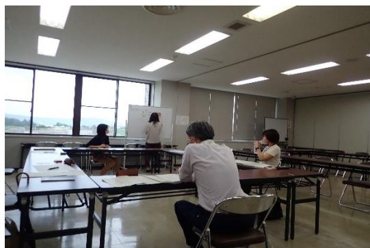
本取組の様子 令和4（2022）年7月21日