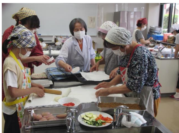
つ乃めぐみ料理体験教室