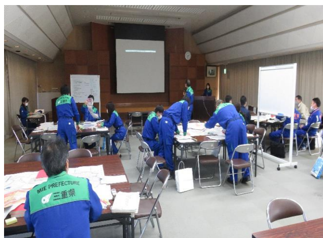
伊賀地方災害対策部運営図上訓練 令和5（2023）年1月11日