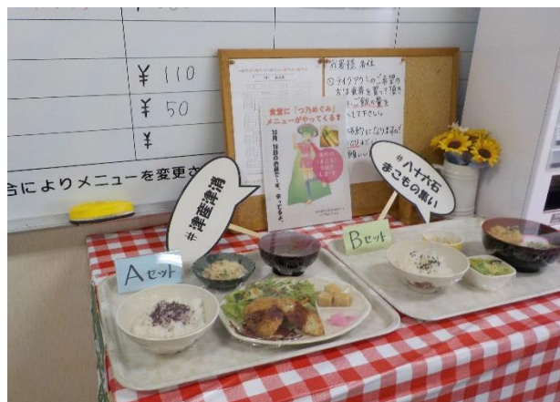
津庁舎食堂『津産津消』試食会