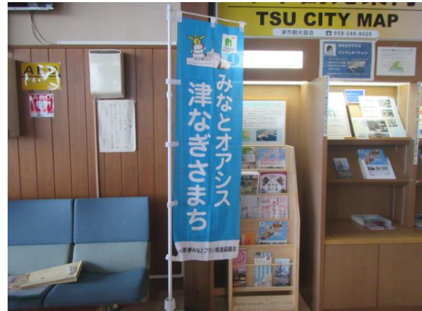
地元産木材パンフレットラック設置（2）