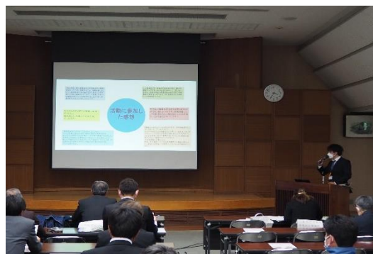
最終報告 令和5（2023）年2月13日