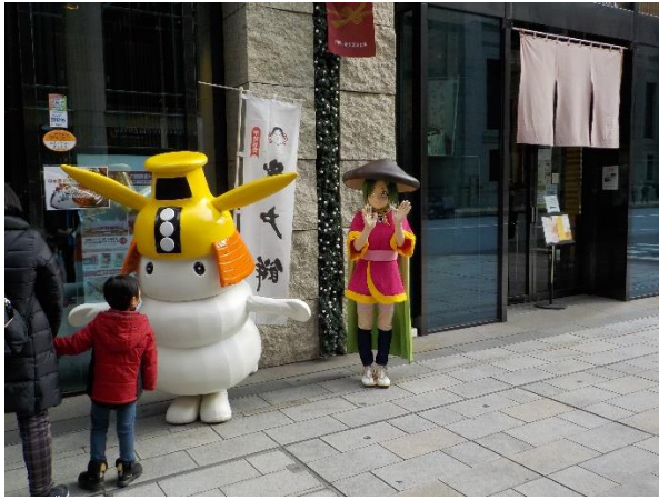
つディ「津ぶぞろいツアー2022」