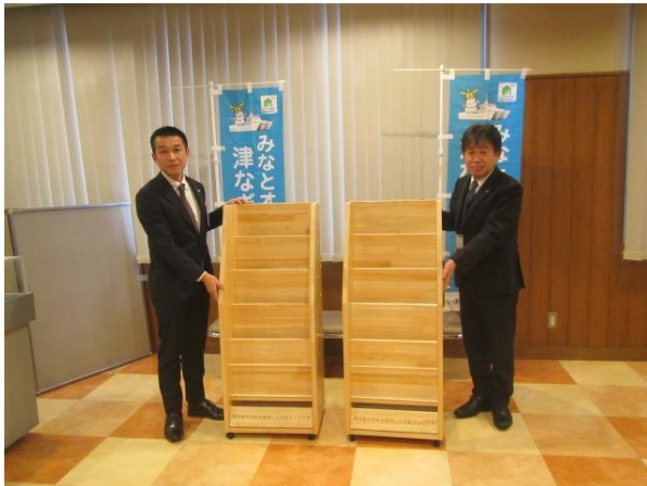
地元産木材パンフレットラック設置（1）