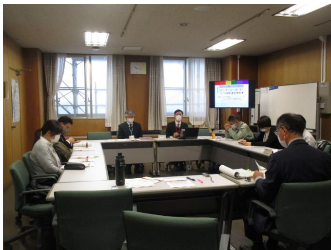
第1回会議（令和4（2022）年12月13日開催）