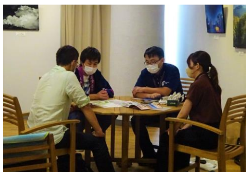
移住相談会（鈴鹿市・亀山市職員による移住相談）