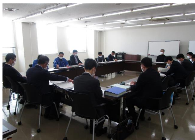
協定締結式（令和4（2022）年9月26日） 第2回会議（令和5（2023）年2月28日）