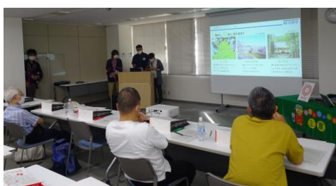
移住相談セミナー（鈴鹿市・亀山市職員による自治体等紹介タイム）

勉強会では、先進的な取組内容や実績を詳しく教えていただき、今後の取組の参考となる情報が得られました。