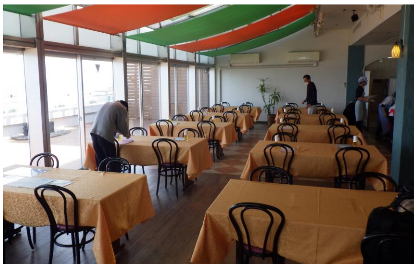
開催日の会場令和5（2023）年2月12日

婚活イベントの開催実績が豊富なみえ出逢いサポートセンターから、婚活イベント企画から運営までのノウハウを学ぶことができました。また、実際に婚活イベントを実施できたことで、企画から運営までのスケジュールリングや当日の運営手法、雰囲気などを肌で感じることができました。