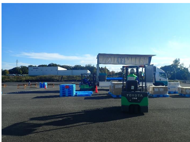
伊賀地方部広域防災拠点実働訓練 令和4（2022）年10月27日～28日