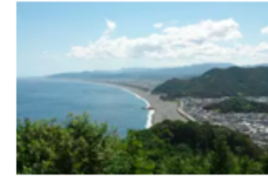
松本峠から望む七里御浜