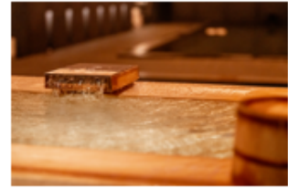
癒しのVISON薬草湯体験