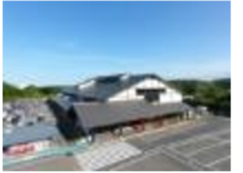
明和町キャンプ地