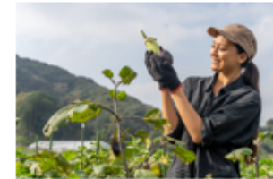
VISONで朝活野菜収穫体験 (2日目朝)