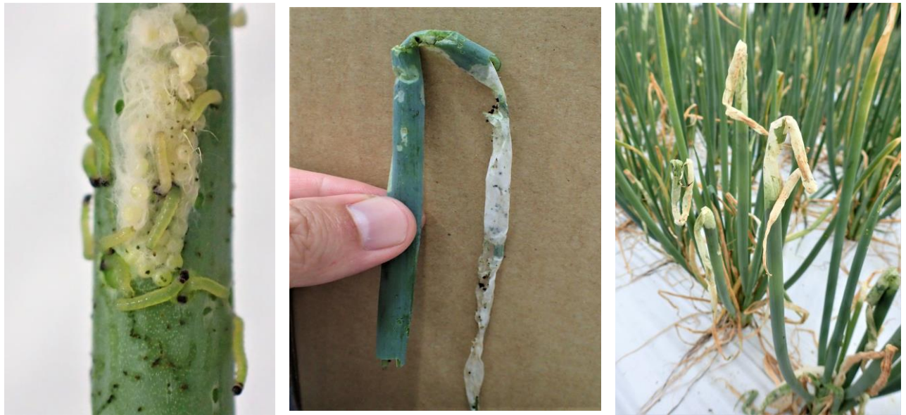
図2 シロイチモジヨトウによるネギの食害 (いずれも令和5年9月4日撮影)