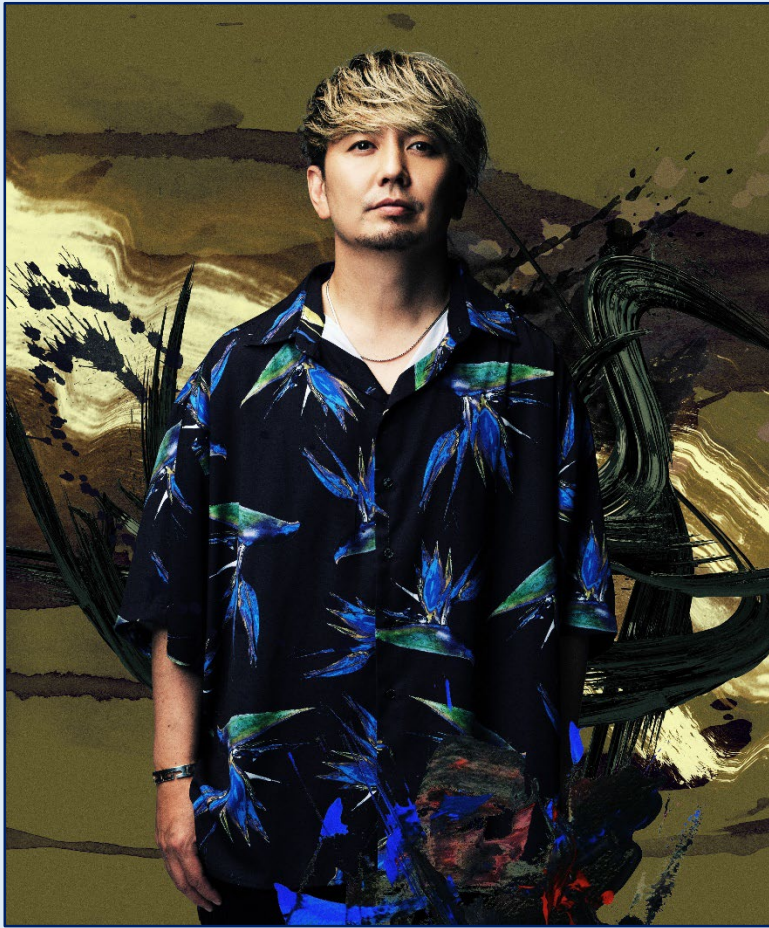
SHOCK EYEさん(湘南乃風) (ミュージシャン)