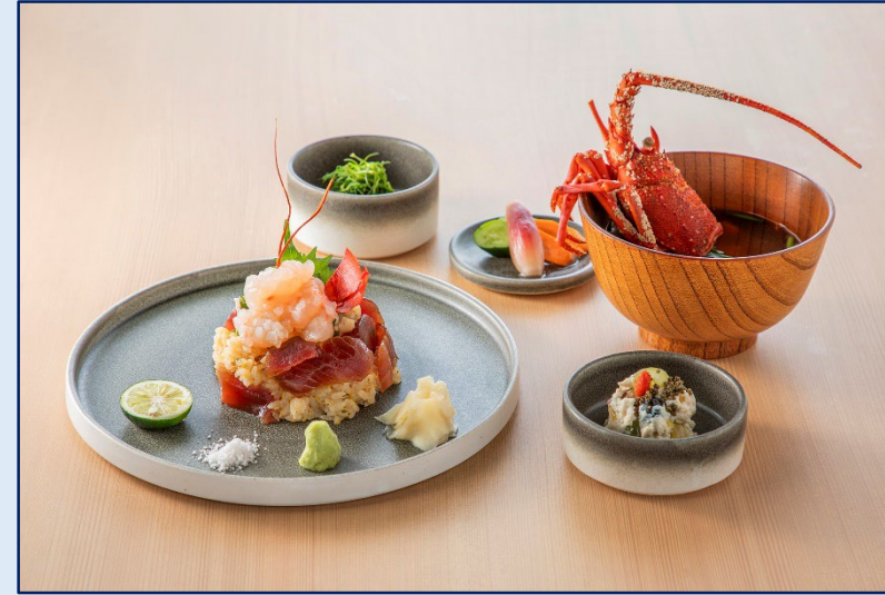
季節の てこね寿司