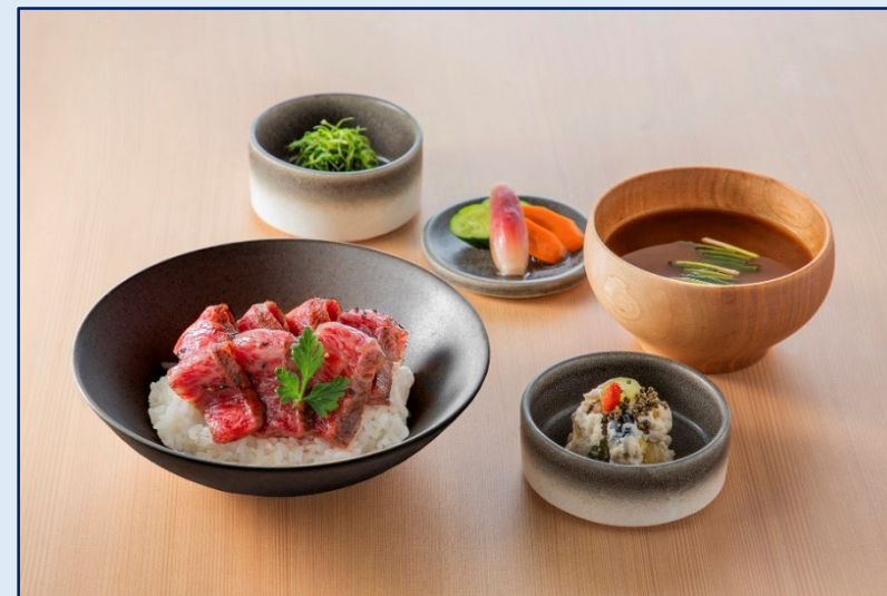
松阪牛 ステーキ膳