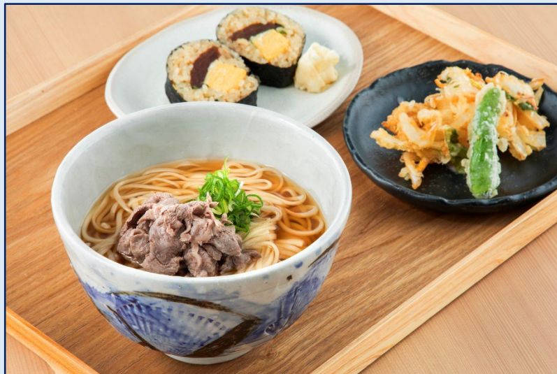
大矢知手延べ あつむぎ膳