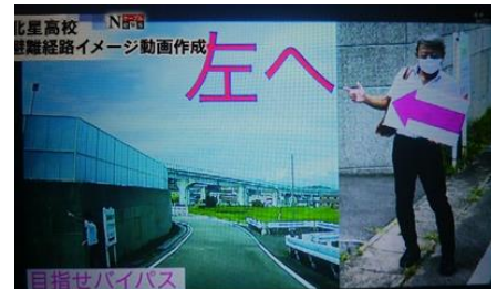
コロナ禍での訓練の工夫として作成したイメージ動画 「目指せバイパス」(生徒にオンライン配信)