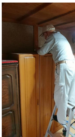
家具固定器具の取付