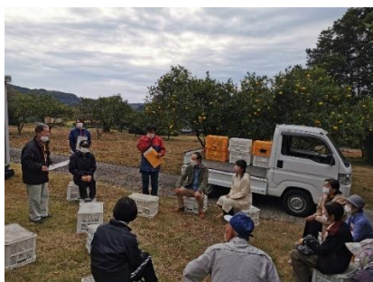
地区の避難訓練実施時に家具固定の重要性を説明

また、「家具固定の推進」においては、地区独自の補助制度を創設し、役員が実際に住宅を訪問して希望の聞き取りや家具固定器具の設置を行い、地域の家具固定を推進しています。これらの取組は、他地域でも参考になるものであり、今後の活動の発展に期待ができるものです。