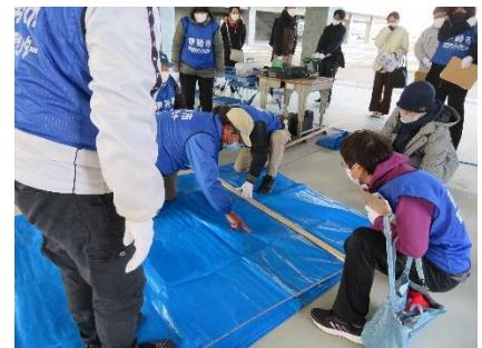
災害ボランティア研修 （ブルーシートの張り方）