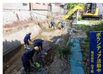
地元河川の清掃活動