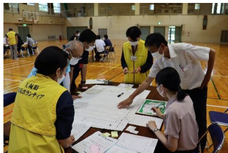
中学校の先生方とHUG