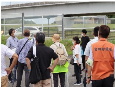
二次避難先のバイパス道路と 近隣公園への避難訓練について 説明する教員

高校生が「率先避難者」として、避難経路沿いにいる高齢者や介護を必要とする住民に対して声掛けをして避難誘導ができる姿をめざして今後の活動も計画しており、こうした取組は他地域でも参考になるものであり、これからの活動の発展に期待ができるものです。