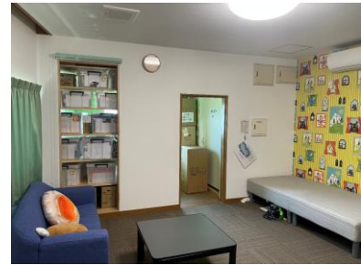
事務所3階 災害時避難施設