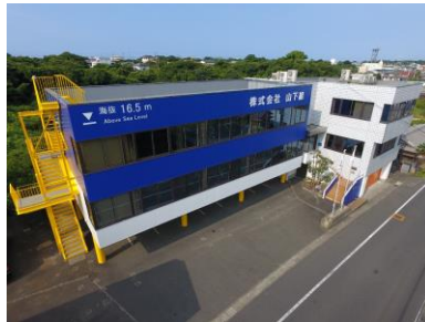
(株) 山下組 社屋 (近景)