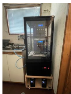
自社サーバーを設置