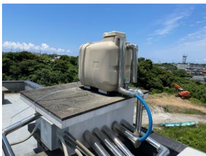
事務所屋上に備え付けの水タンク