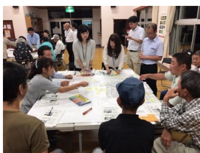
避難所運営マニュアルの作成