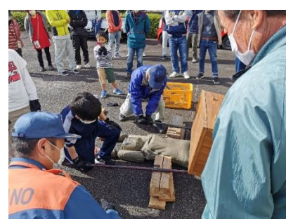
総合防災訓練での住民レスキュー訓練