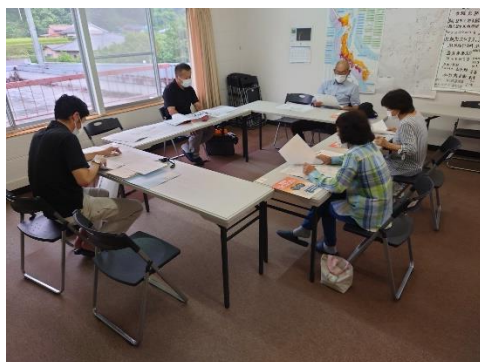
「避難行動要支援者名簿」の精査