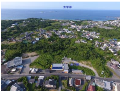
(株) 山下組 社屋 (遠景)

こうした同社の取組は、地域と企業が連携して防災・減災対策を進めるにあたっての先進的なモデルとなるものです。