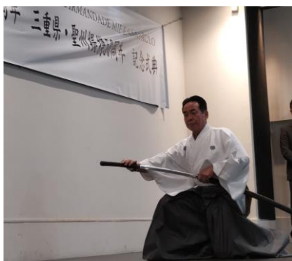
(アトラクション2：中森議長)