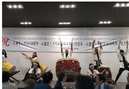
(アトラクション1：バストス昇竜太鼓)