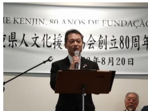
(祝辞を述べる一見知事)