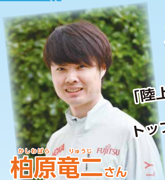
かしわばら 柏原竜二 さん

「陸上」と「レスリング」 垣根を越えた トップアスリートの2人が ここ三重の地で 熱く語る！