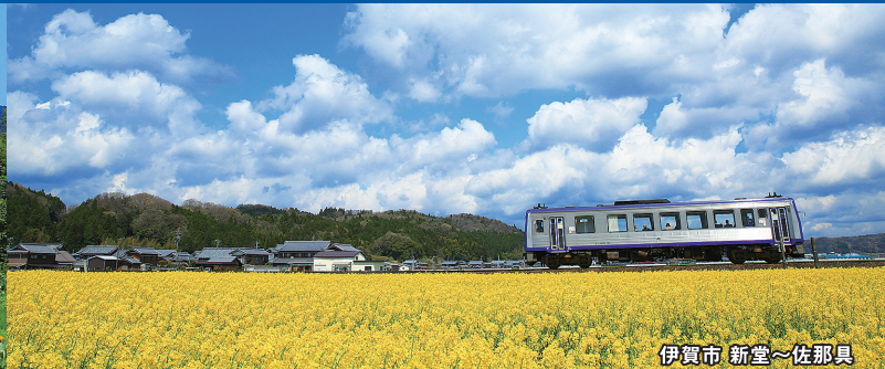
伊賀市 新堂～佐那具

新たにJR関西本線(亀山～島ヶ原間の全部又は一部の区間)を通勤利用し モニタリング調査にご協力いただける従業員(モニター)を対象に