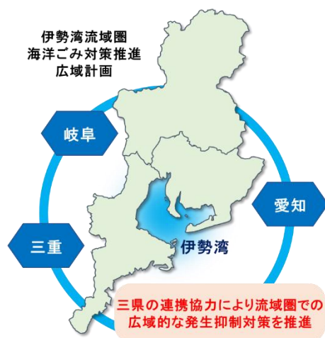
計画のイメージ図

三県、県民、民間団体、事業者、市町村及び海岸管理者等の伊勢湾流域圏の多様な主体がそれぞれの役割を果たしながら相互に連携し、一体となって海洋ごみ対策を実施します。