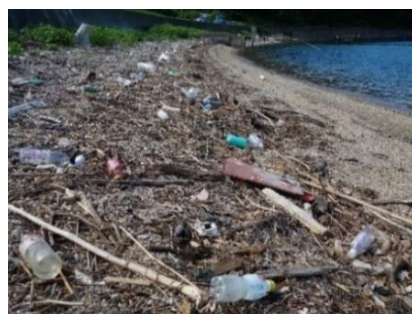
海岸に漂着したプラスチックごみ

本県では、「三重県海岸漂着物対策推進計画」に基づき、海洋ごみの回収処理や発生抑制対策の取組を行っています。海洋ごみの中には、県外から流出したものが含まれており、海洋ごみ対策を更に強力に推進していくためには、流域圏で連携して取り組むことが重要です。