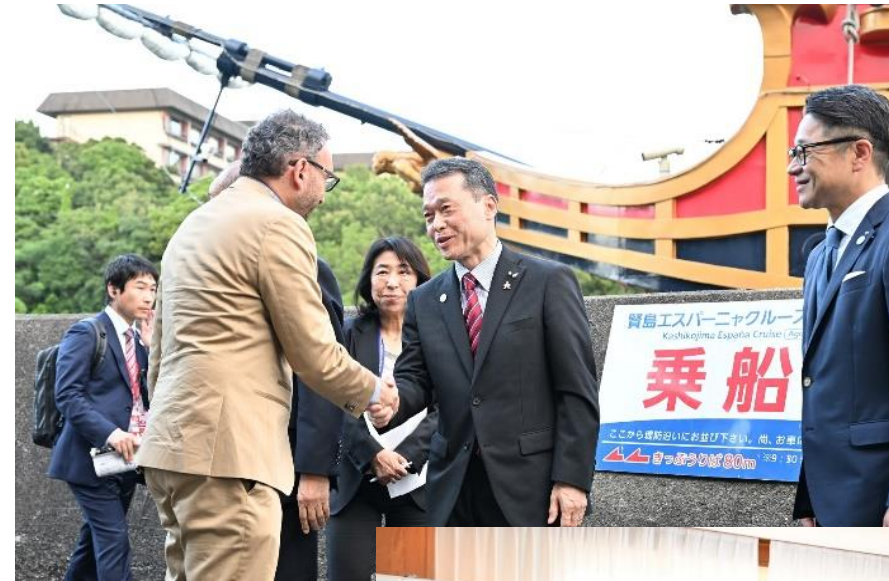
1日目（16日） エスペランサ号乗船