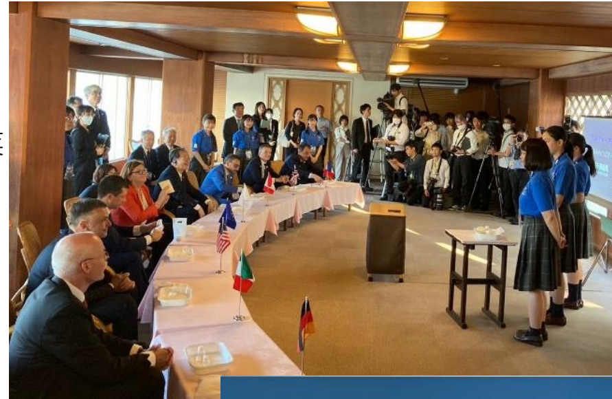
2日目（17日） 外国語案内 ボランティア （高田高校）