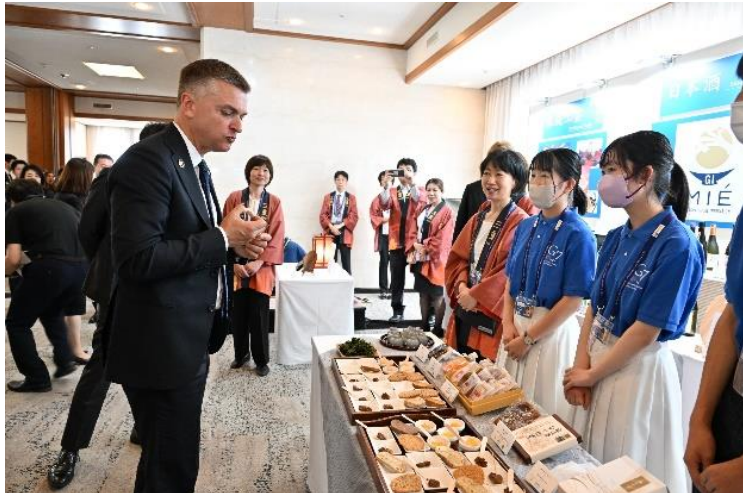
三重県産食材の展示・試食