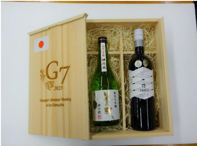
記念品贈呈用の日本酒の木箱の製作（伊勢工業高校）