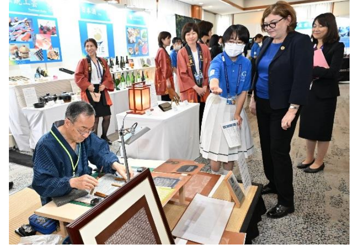
伊勢形紙の展示・実演