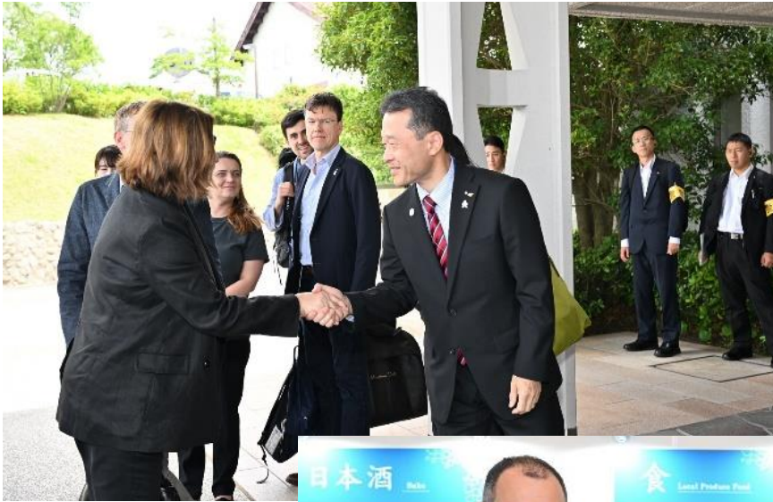
1日目（16日） 各国代表団をお出迎え