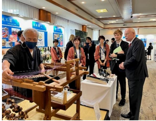
伊賀くみひもの展示・実演