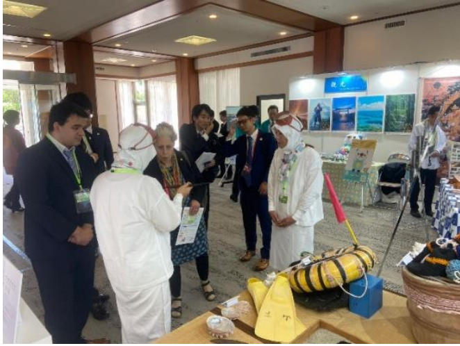
各国代表団に説明をする現役海女