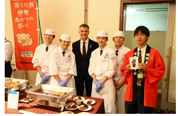
1日目（16日）レセプション高校生のライブ料理（相可高校、明野高校）