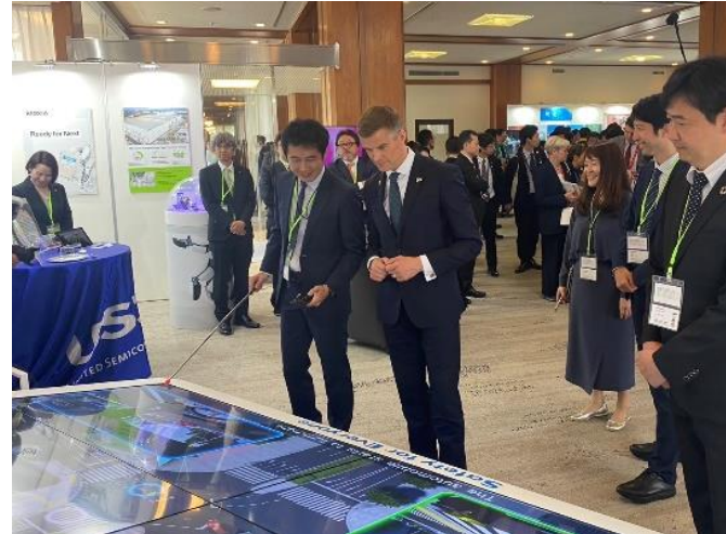
自動車・半導体産業の展示