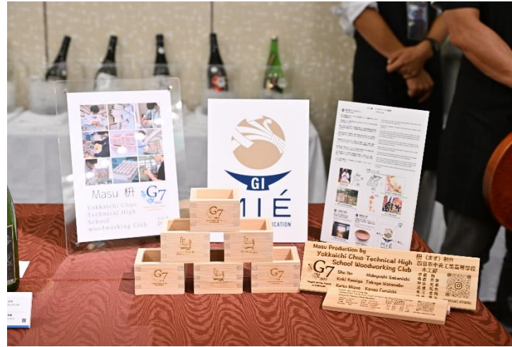
1日目（16日）レセプション乾杯用の枡の製作（四日市中央工業高校、四日市工業高校）