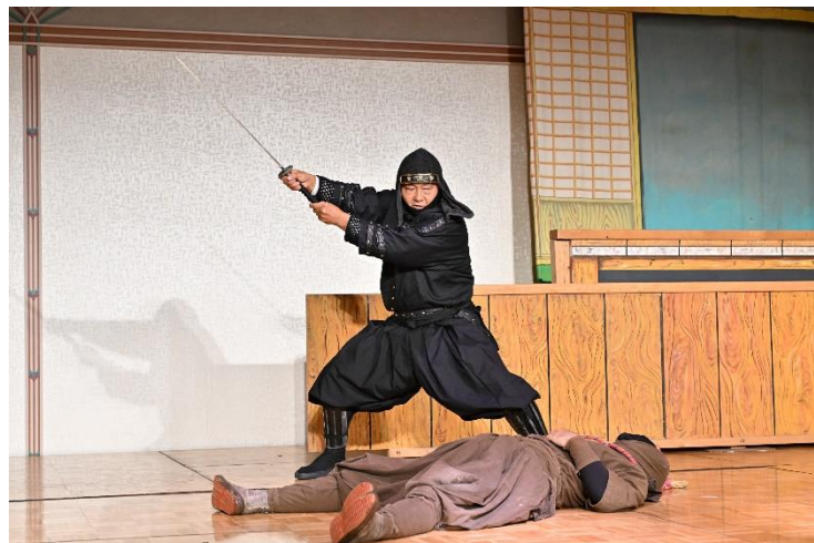
阿修羅による忍術実演