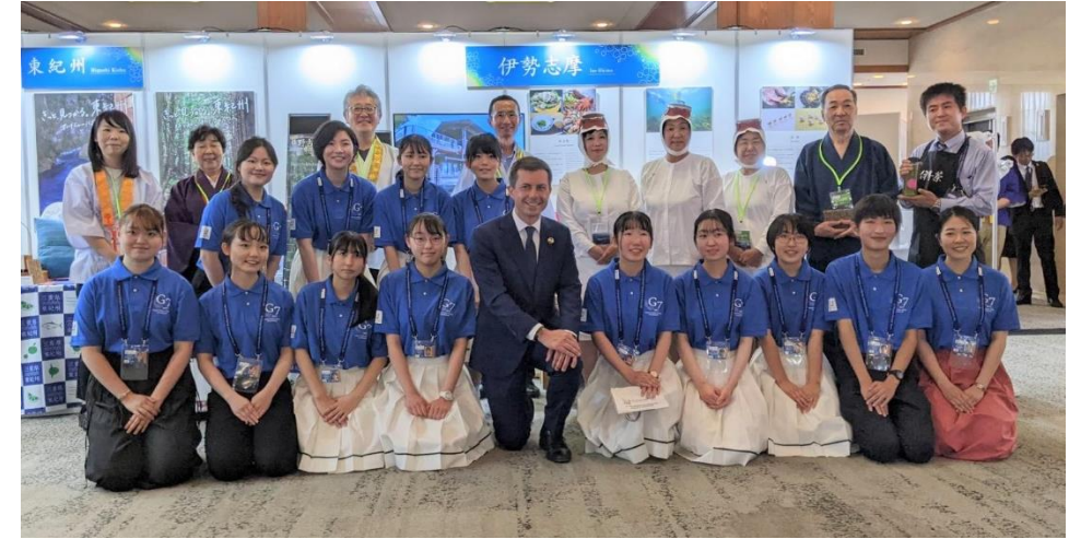
アメリカ運輸長官と展示ブーススタッフ