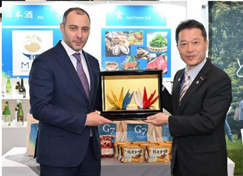
2日目（17日） ウクライナ副首相への記念品贈呈