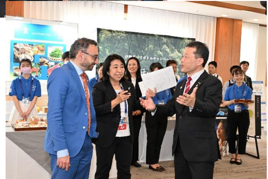
3日目（18日） 三重県展示ブースをご案内