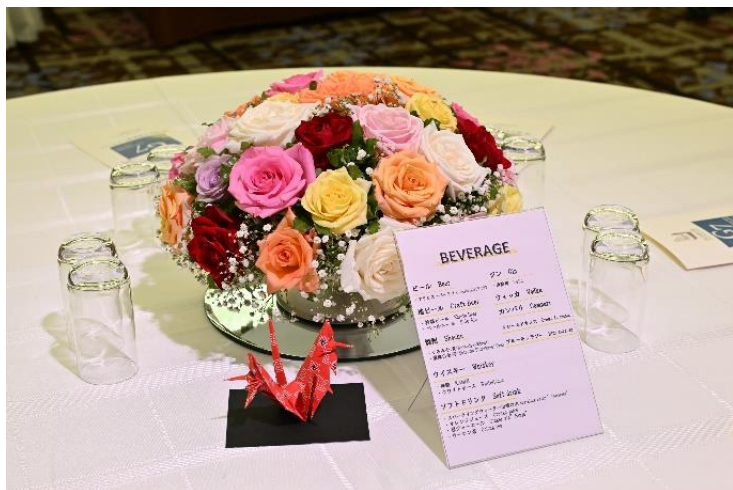
伊勢のバラ、桑名の千羽鶴の会場装飾