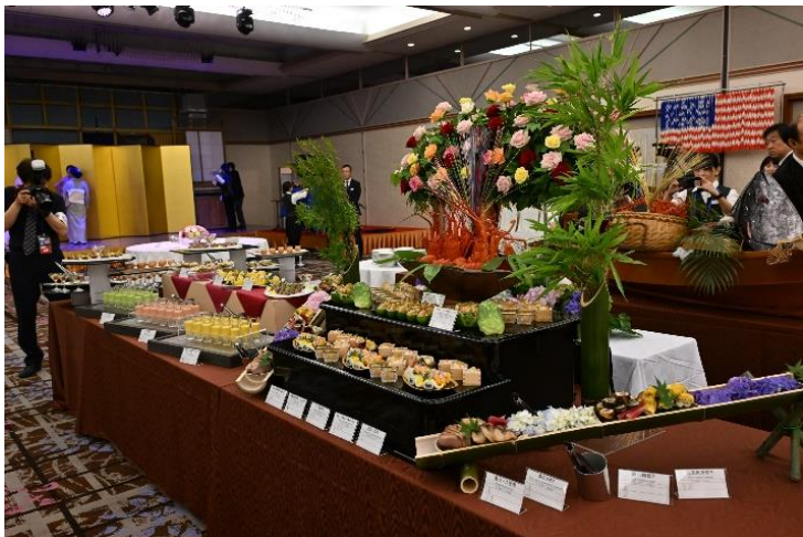
三重県の食材を使った料理を提供