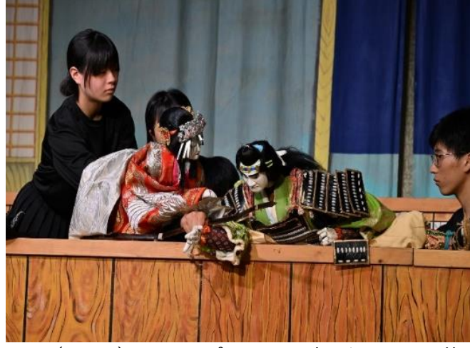
1日目（16日）レセプション安乗の人形芝居（志摩市立東海中学校）