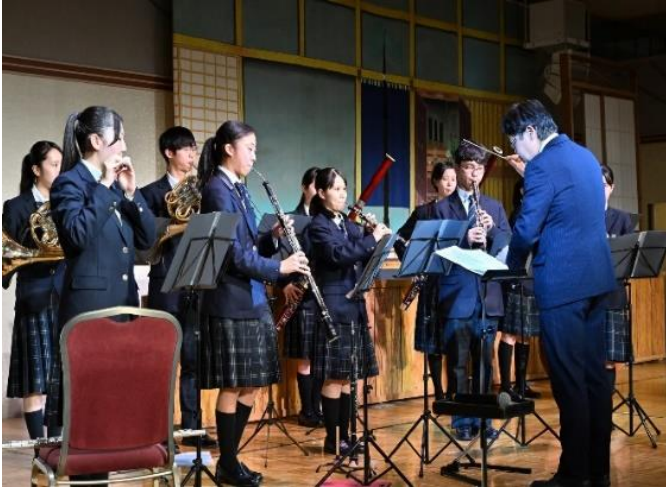
1日目（16日）レセプション歓迎演奏（白子高校）