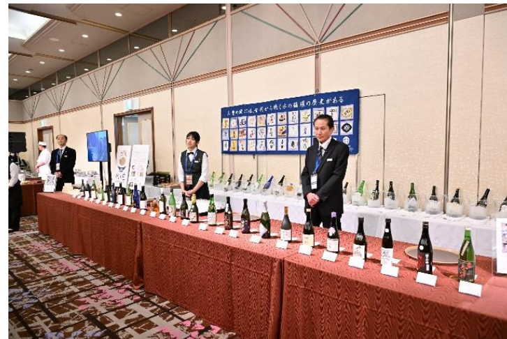
三重の日本酒を紹介・提供