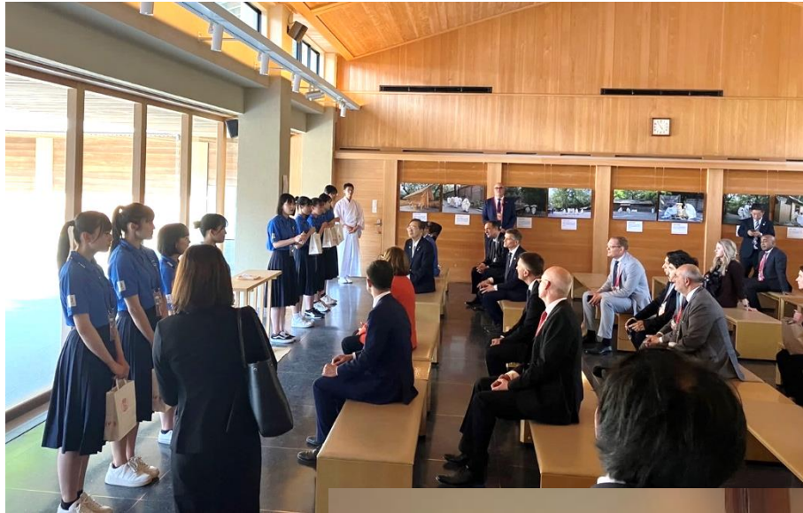
2日目（17日） 外国語案内 ボランティア （宇治山田商業 高校）