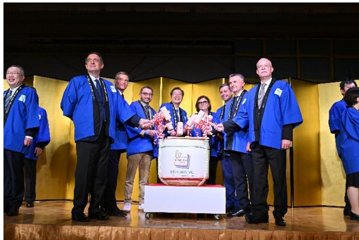
三重の日本酒で鏡開き