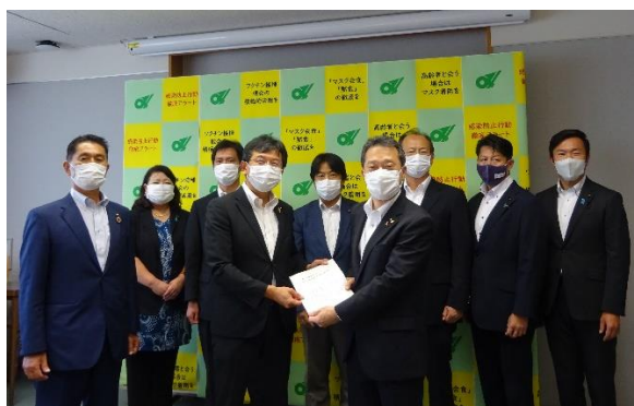
図5-2 知事への申入れ（令和4年7月25日）

これらの調査結果に基づき、「県政レポートに基づく今後の県政運営等に関する申入書」を作成し、予算決算常任委員会正副委員長と各行政部門別常任委員長の連名で、8月上旬 40 頃に知事に対して申入れを行います。