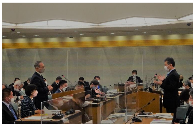
図5-1 総括質疑（令和4年10月31日）

総括質疑の方法は、午前2時間、午後2時間の合計4時間について各会派に質疑時間を配分し、発言通告制を用い、知事の出席を求めて対面演壇方式で行っていましたが、平成18年10月からは発言通告制を廃止して行っています。