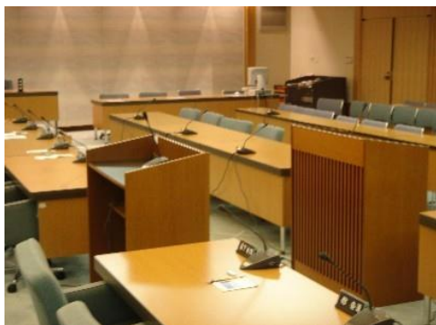
図 5-3 対面演壇の配置