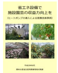
▲省エネで収益力向上を