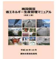
▲省エネマニュアル