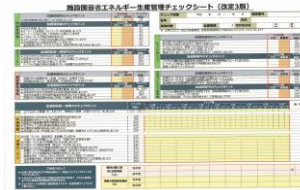
▲省エネチェックシート