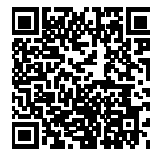
▲省エネ通知のページQRコード