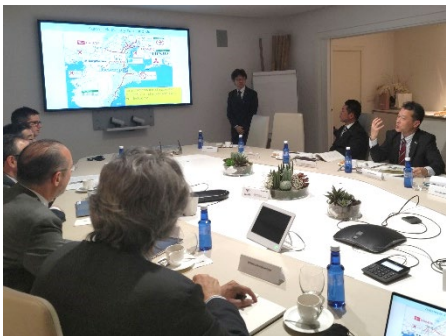
ゲスタンプ社でプレゼンをする一見知事