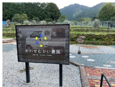
尾鷲ヤードサービス株式会社 （おわせむかい農園）

また、尾鷲市の「みんなの森プロジェクト」における脱炭素化の機運と連動し、地域住民とのワークショップを通じた「森と畑を楽しむキャンプエリア」構想や、郷土料理の商品開発などの向井地区の活動計画を策定するため、脱炭素化に取り組んでいる事業者から専門的見地のアドバイスをいただきました。