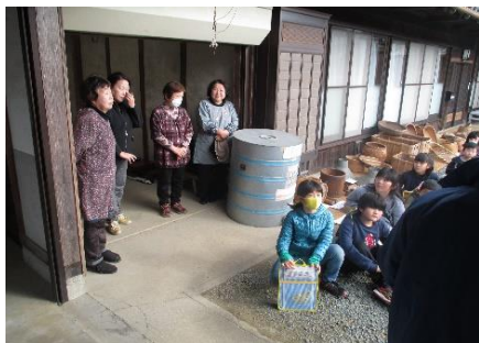
昔の文化体験教育

そこで、様々な場所に簡単に運べ、設営できるワンタッチテントを導入し、休憩場所に活用しました。また、朝市などの直売にも活用しました。