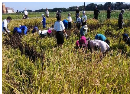
田んぼアートでの収穫体験