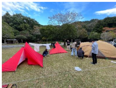
キャンプの試験実施