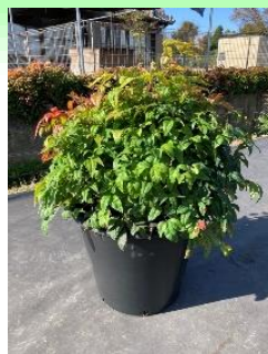
大鉢生産 (オタフクナンテン)