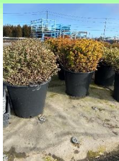
大鉢生産 (白丁花、ボックスウッド)

そこで、45cm鉢という他にはあまり見られない商品づくりと、生産樹種が多いという強みを活かし、他県で生産されていない樹種の大鉢生産を積極的に行い、園芸緑化に応え得るオンラインワンの商品を提案していきます。