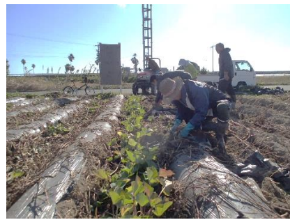
サツマイモの収穫 (10月)