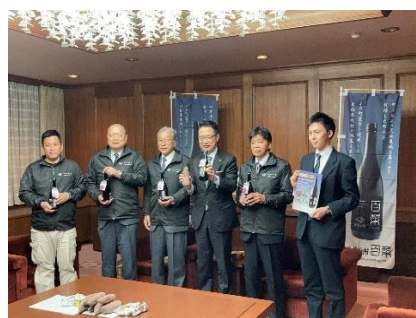
津市の前葉市長を表敬訪問