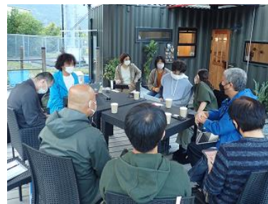
地域活動計画の策定への 専門的アドバイス