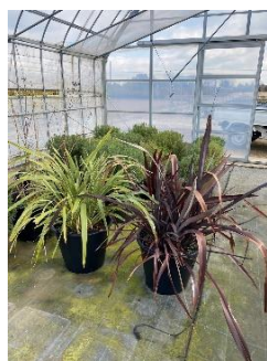
大鉢生産 (ニューサイラン)