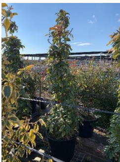
大鉢生産 (オオカナメモチ)