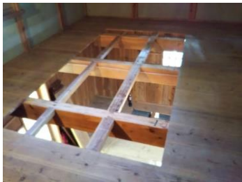
1,2階の床仕事は大工

その際に出た、今までの古い床材は本棚や棚板などに再利用するために水で磨き洗いしました。