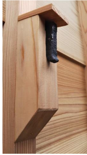
鉄の釘は 30 cmの長さで土壁の穴に通される