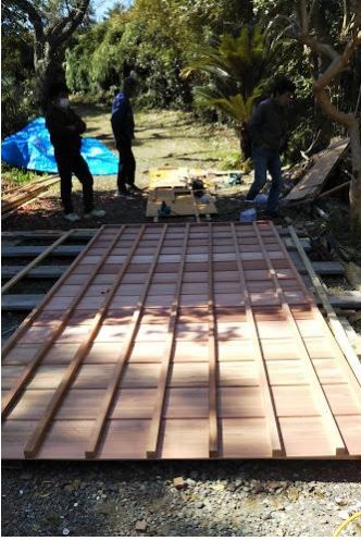
蔵が傾いていたので部分ごとに取り付けた