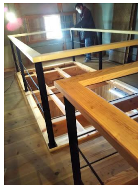
手すり、本棚は古い材を DIY で取り付けた